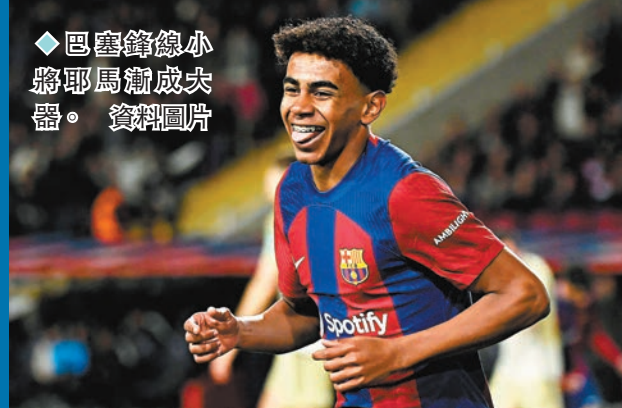
◆巴塞鋒線小將耶馬韋成尖砲。