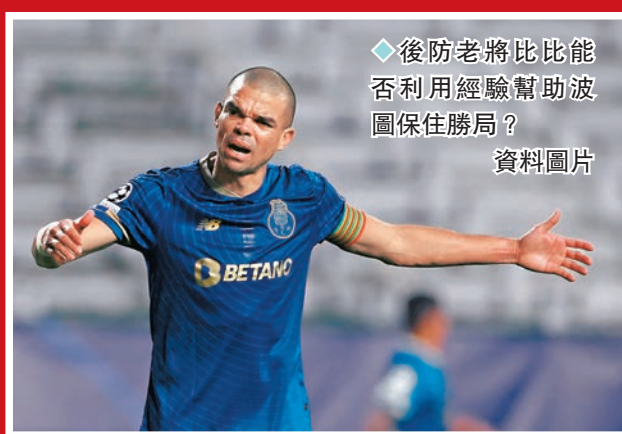
◆後防老將比比能否利用經驗幫助波圖保住勝局？

現排名葡超第 3 位的波圖，上仗歐聯憑中場加連奴一箭定江山擊敗阿仙奴，不過八強席位尚未穩陣。其實波圖 14 年前也曾首回合領先 2:1，次回合卻在酋長球場遭阿仙奴狂轟 5 蛋出局，亦是阿仙奴最近一次能殺入歐聯八強。「兵工廠」此番再次在近 13 戰 10 勝的主場迎敵，夏維斯說：「我們可實現 14 年來從未做過的事（入八強），這是挑戰。請球迷給我們更強力的支持，因為這將給予我們很好的晉級機會。」