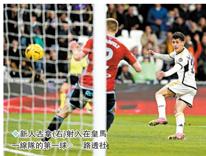
◆新人古拿(右)射入在皇馬一線隊的第一球。