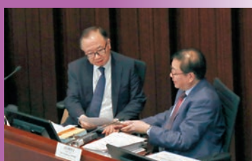
◆秘書處職員查看文件。