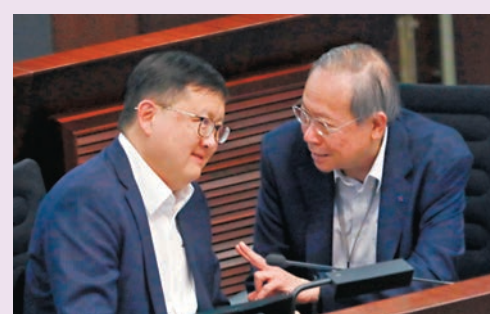
◆議員互相交換意見。