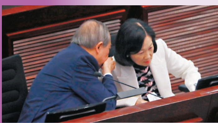
◆葉太與議員交頭接耳。

律政司司長林定國回應說，由於本地的律師、大律師、醫生等專業都是需要註冊，該人如被指名為潛逃者，其專業資格便會自動失效，不用專業團體做些什麼，而保安局局長亦會通知相關專業團體更新名冊。鄧炳強進一步解釋說，倘潛逃者純粹以香港的專業資格，而取得海外資格，然後做了律師，在香港根據條例取消了相關資格後，會通知相關機構，可能外國相關機構亦要考慮其資格。