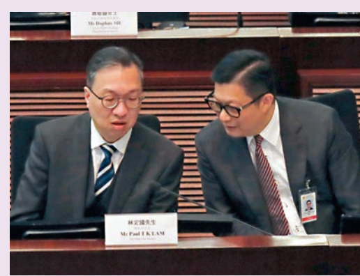
◆林定國與鄧炳強交流。