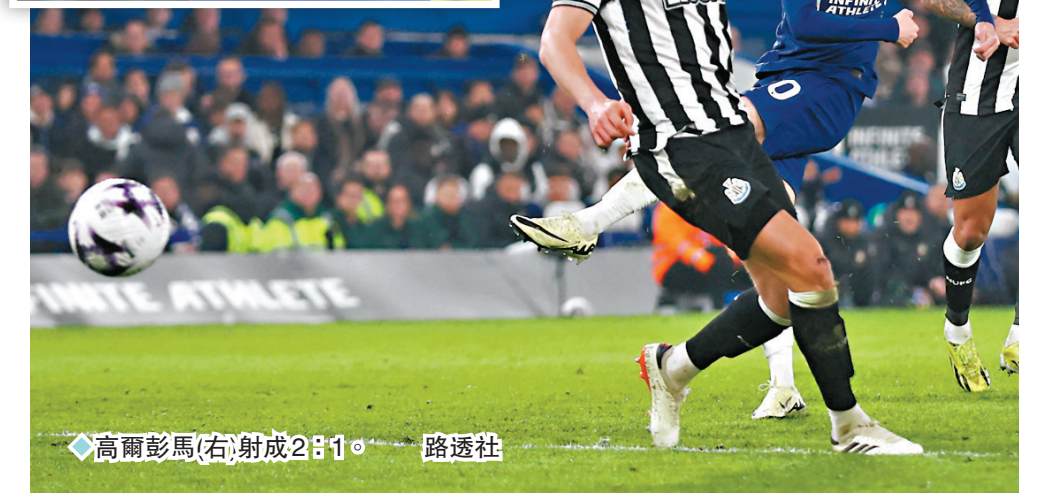
◆高爾彭馬(右)射成2:1。