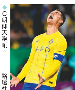
◆C朗仰天咆吼。

香港文匯報訊（記者 楊浩然）有C朗拿度壓陣的沙特阿拉伯勁旅艾納斯，於香港時間昨日凌晨亞冠盃8強次回合比賽，主場僅以3:2擊敗阿聯酋的艾阿恩，兩回合合計3:3要加時，結果雙方30分鐘內再各入1球，總比數4:4要互射12碼分勝負，最終艾納斯有波索域、阿歷士迪尼斯和艾美臣都「宴客」，12碼輸1:3被踢出局。