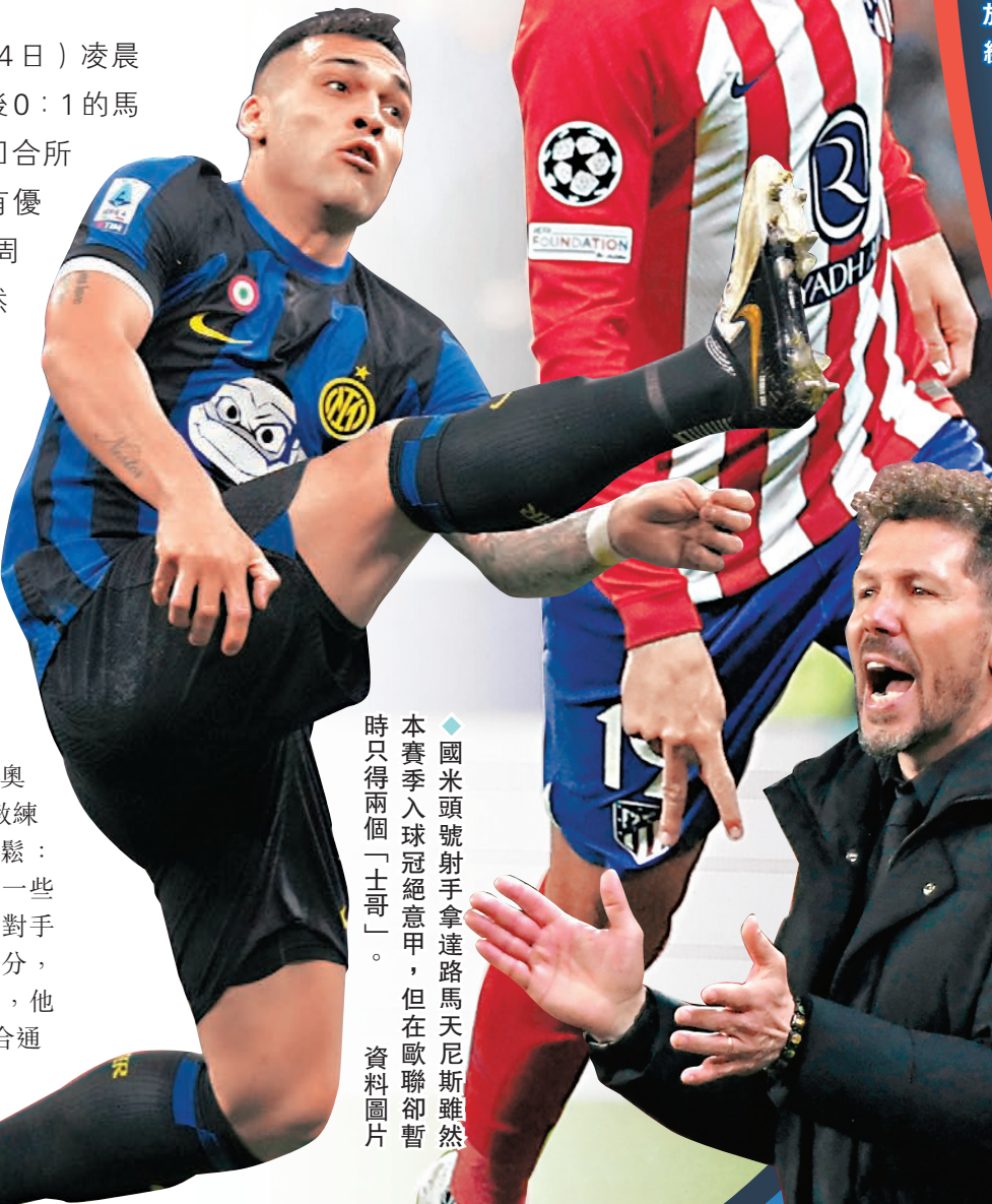
◆國米頭號射手拿達路馬天尼斯雖然本賽季入球冠絕意甲，但在歐聯卻暫時只得兩個「士哥」。資料圖片

襲。」國米是目前歐洲五大聯賽中近績最佳的球隊之一，整個2024年所向披靡保持全勝；然而要注意的是，國米今年所遇對手絕大部分均是意大利國內的手下敗將，但在上年尾的歐聯分組賽，國米其實於分組賽未能作客擊敗皇家蘇斯達和賓菲加，足證在歐洲賽客場並非所向無敵。再者，上回合贏波功臣阿拿奧杜域是役亦因受傷缺陣，難怪教練施蒙尼恩沙基賽前亦未敢放鬆：「我們首回合表現不差，但在一些細節上卻做得不好，除給予對手一些機會，同時又不能擴大比分，要知道馬體會是一支頂級球隊，他們必會竭盡所能，務求在次回合通過主場之利爭勝，我們必須小心應對。」