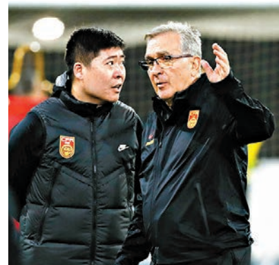
◆國足新任主帥伊萬科維奇(右)帶隊訓練。

賽,以及之前國家隊的比賽進行了分析,發現我們的球員有進步的可能。」伊萬透露,「中方教練組給了很多建議和他們的經驗,我們的目標是一致的。我們這次有5個之前從來沒有入選過國家隊的球員,我們會觀察他們的表現。」