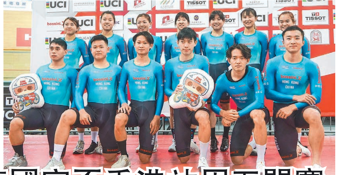
◆香港單車隊以年輕陣容於主場爭取佳績。