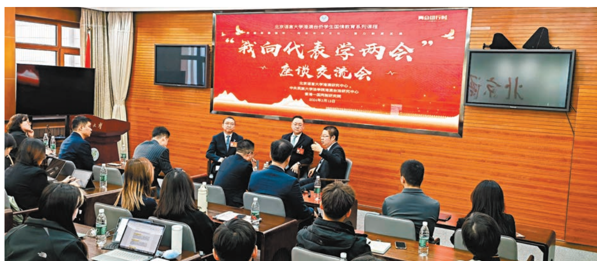
◆北京語言大學港澳「我向代表學『兩會』」座談會13日在北京語言大學逸夫樓舉行。

學生們還就新質生產力、粵港澳大灣區建設、兩地融合發展以及青年學生關心的就業、發展等問題，與兩位代表交流互動。