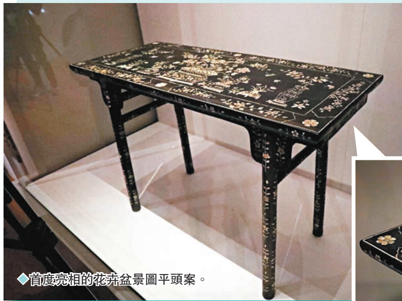
◆首度亮相的花卉盆景圖平頭案。

另外，「香港賽馬會呈獻系列：故事新說——故宮博物院藏 明代人物畫名品」第二期共20套全新珍品，於昨日起在香港故宮文化博物館展廳4開放公眾參觀。本期重點展品包括唐寅和仇英的佳作，二人均為「明四家」中的翹楚。當中一幅國家一級文物唐寅的《風木圖》繪風中枯木兩株，一文士倚坐樹間，掩面哭泣，似在悲思故人。「風木」比喻父母亡故，未及奉養。