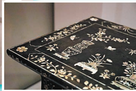
◀花卉盆景圖平頭案由兩地文保人員攜手修復。