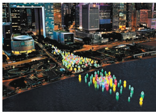
◆由國際藝術團隊 teamLab 打造的「teamLab：光漣」展覽構想圖。