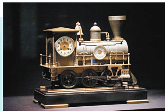
▲首度亮相的火車頭式鐘。