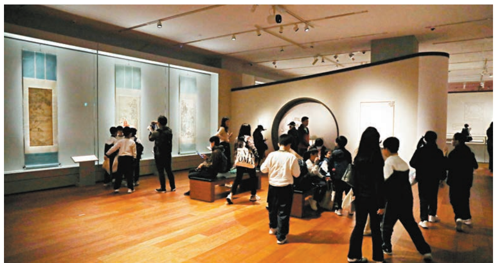
◆市民參觀「香港賽馬會呈獻系列：故事新說——故宮博物院藏 明代人物畫名品」第二期展覽展區。