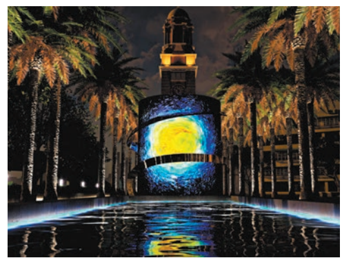
◆「梵高·樂印」展覽構想圖。

◀「teamLab：光漣」展覽，在添馬公園和中西區海濱長廊之間的路段以及海面，會有數百個3米至5米夜光彩蛋（ovoid）的藝術裝置。