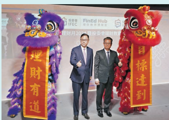
◆陳茂波(右)表示，投資者需要持續提升自己的數碼理財知識和技能。左為杜淦堃。

香港文匯報訊(記者 岑健樂) 投資者及理財教育委員會(投委會)昨宣布，推出全港首間數碼體驗模式理財教育體驗館——投委會理財教育體驗館，為香港市民提供數碼化及嶄新的投資者及理財教育學習體驗，並於同日舉行「香港理財月2024暨投委會理財教育體驗館開幕典禮」。