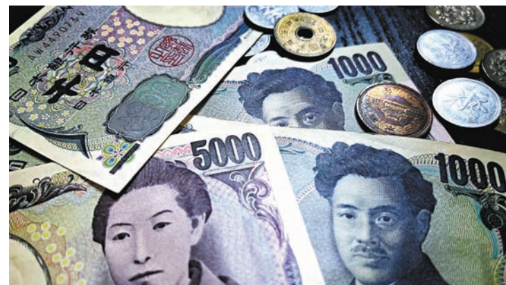
◆日本官員最新言論打消了人們對日本央行可能即將取消負利率政策的押注。 資料圖片

美元兌日圓上揚，正探試着148關口，日本官員的最新言論打消了人們對日本央行可能即將取消負利率政策的押注。日本央行總裁植田和男對日本經濟的評估略低於他在1月份的評估，而財務大臣鈴木俊一則表示，日本還沒有達到可以宣布戰勝通縮的階段。目前，交易員們正在關注將於周五公布的春季工資談判初步結果，此次談判結果對於日本央行在下周會議上決定是否退出負利率政策至關重要。日本一些大型企業已經表示，他們已經同意在年度工資談判中完全滿足工會的加薪要求，因此人們預期