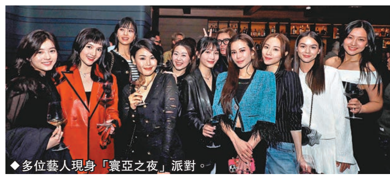
◆多位藝人現身「寰亞之夜」派對。