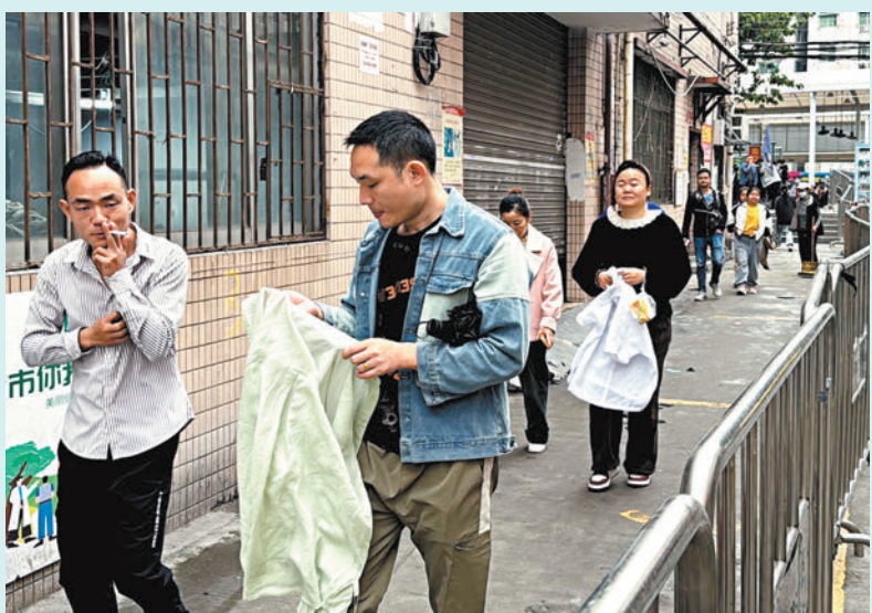
雙方講清工序、工價、出貨量等關鍵信息後，覺得合適就迅速前往作坊或工廠開始做工，當天完工後計件結錢。