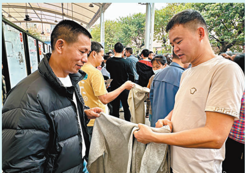
招工老闆與製衣零工之間憑「樣衣」交流。