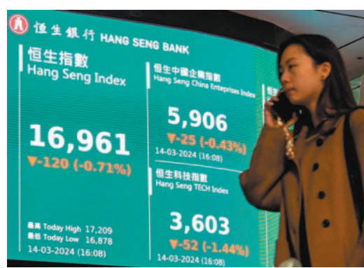
◆ 港股昨先升後跌,失守萬七關口。 中新社

港股方面,恒指先升後跌,在藥明系及友邦(1299)等急挫下,收市倒跌120點報16,961點,失守17,000點關口,成交額仍達1,131億元。市場人士指出,美國國會通過對字節跳動強制分拆的議案,亦有美國生物科技組織將剔除藥明康德(2359)的會員資格,顯示美國對中企的打壓一直沒有放鬆,有關消息將影響股民的投資情緒,打擊港股的反彈勢頭。