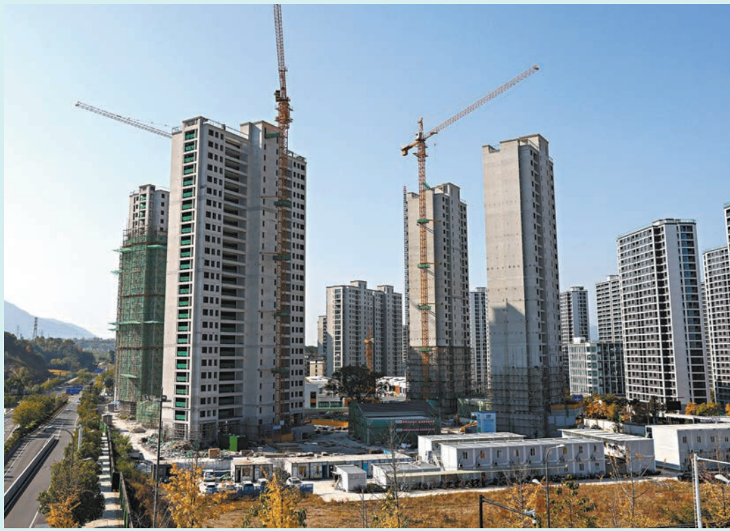
◆有分析認為，杭州樓市新政具較強示範效應，未來更多城市有望跟進實施稅收優惠政策，通過調整增值稅、個稅徵免條件減輕住房交易負擔。圖為杭州一處在建住宅。