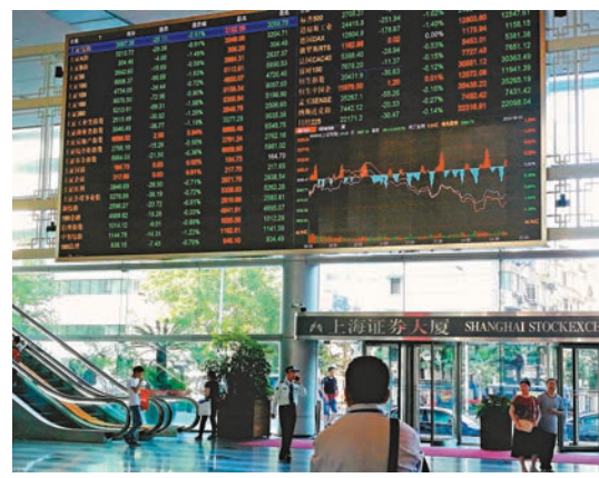
◆滬指昨收報3,038點，微跌5點。

國際金價頻創新高，貴金屬板塊領漲兩市，金銀業漲停，紫金礦業漲5%，中潤資源漲3%，中金黃金、四川黃金漲2%。生物製品、醫療、化學製藥等板塊也都整體收漲。但因美國生物技術創新組織（BIO）宣布將剔除藥明康德的會員資格，藥明康德A股挫5.71%。前日飆升的遊戲板塊回調，跌超3%，航天航空、文化傳媒、半導體、消費電子等板塊低收2%。