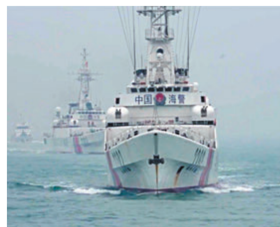
◆3月15日，福建海警在金門附近海域依法開展執法巡查。 視頻截圖

陳斌華強調，台灣是中國的一部分，大陸海警部門在金門附近海域開展執法巡查，是維護相關海域