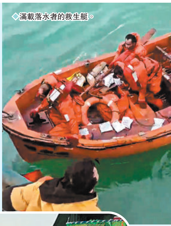
◆滿載落水者的救生艇。