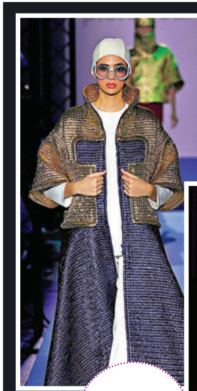
◆ Pierre Cardin 秋冬新品成衣。