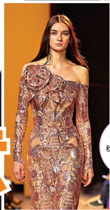
◆ Elie Saab 秋冬新品成衣。