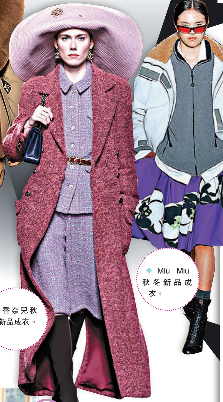
◆ Miu Miu 秋冬新品成衣。