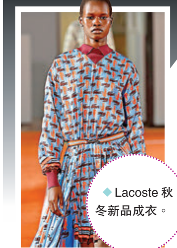
◆ Lacoste 秋冬新品成衣。

今年，Lacoste 再度回歸巴黎時裝舞台，秀場地刻意挑選法國網球公開賽的紅土球場舉行。今季設計可見大量的正裝與學院風造型，散發法式優美典雅的美學，並帶來充滿活力的設計系列，透過品牌早期的鱷魚圖騰設計成Monogram 衣物並移植到不同服飾上，更注重女網球員經常穿著的百褶裙細節，展現出獨特的普普藝術風格。加上，整體配色上緊貼網球主題，以綠、紅、橙貫穿點綴，將精細剪裁與利落線條透過時裝與運動元素融合。