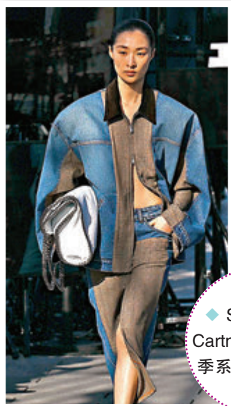
◆ Stella McCartney 2024 冬季系列。

而且，在今季中，鱷魚皮壓紋風衣和短裙均由蘋果基UPPEAL 材料製成，這是一種替代動物皮革的純素面料，在工場染色過程中未使用任何有害或致癆化學物質。外套以及針織衫由羊毛面料拼接而成，憑藉獨有的磨毛紗線縫紉，形成全新紋理質感，例如由其拼接而成的高領編花針織衫。