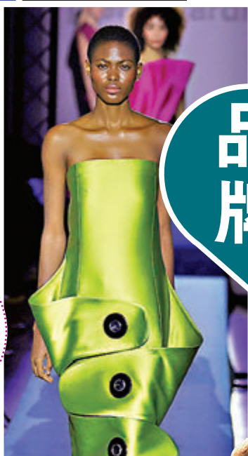
◆ 愛馬仕秋冬新品成衣。

在為期一周的時間裏，這座「光之城」上演了一場精彩絕倫的時裝秀，比如Chanel、Miu Miu、Valentino、Louis Vuitton、Dior、Balenciaga、Loewe、Saint Laurent、Elie Saab、Lacoste、SHIATZY CHEN等焦點品牌的時裝秀，展示2024-2025年秋冬成衣系列，奢華的面料、奇妙的剪裁和珍貴的細節融為一體，創造出獨一無二的時裝傑作，賦予了時尚之都巴黎高貴的氣質。現在，就讓大家在這兒欣賞一下，多個品牌於巴黎時裝周發布全新的秋冬新品成衣，展現品牌的創意成果。