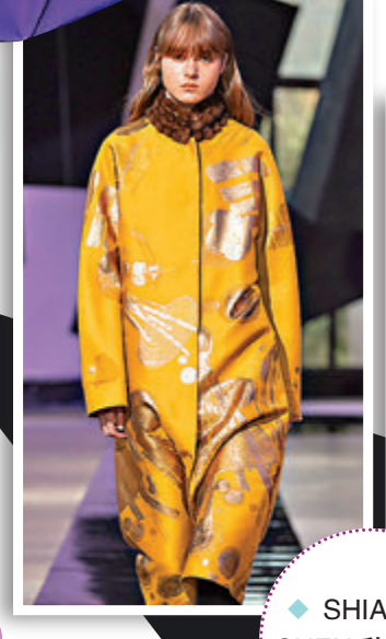
◆ SHIATZY CHEN 秋冬系列。

綜觀今季，大篇幅墨色服裝所帶來的感官震撼，不論是細節中，黑色金屬綻花間藏有的黑鐵金色紗線，表現出力度猶存的刷墨層次，或中式刺繡疊上西式緞帶產生的堆墨效果，抑或添上的黑流蘇、黑毛料毛海，詮釋着墨花亦動亦靜的戲劇張力。而墨，不僅止於黑的表現，深究東方文化下，結合明代文物——集錦墨，將墨鐵金黃、帝王紫，妝點了系列色彩，同時也更加凸顯出，墨，本身獨樹一幟的靜謐氣質。