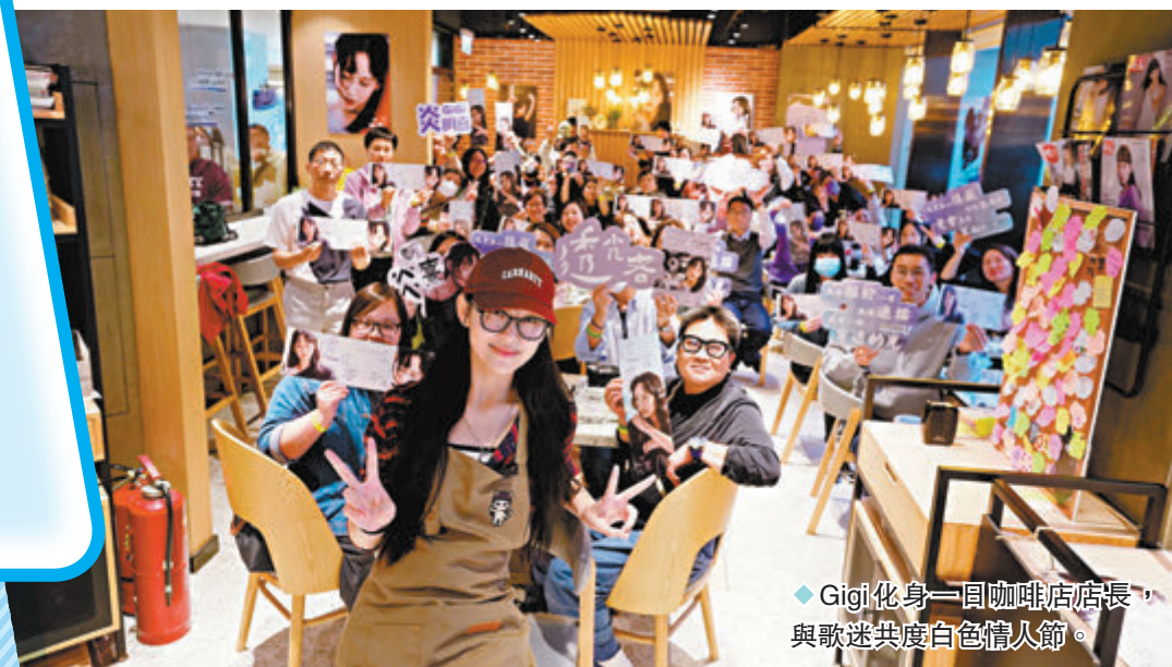
Gigi化身一日咖啡店店長，與歌迷共度白色情人節。

提到在白色情人節當一日店長，Gigi希望帶給大家一種「甜」，說：「無論大家有沒有情人，我都想借機會去多謝支持我的人，另外一個好消息是我的新歌《透光者》MV，網上點擊已經突破一百萬，所以好多謝大家。」新歌MV上載短短兩個星期就有佳績，歌迷會特別準備了蛋糕與Gigi一起慶祝。問到Gigi是否已投入演唱會採排，她流露為難的眼神說：「我之前講過，希望可以日日做運動、練歌，但手頭上其他工作未完成，運動暫時未可以日日做到，飲食方面都會好小心，要食得開心也要控制到胃口。」早前在社交網公開收集粉絲意見為演唱會請嘉賓，Gigi笑言反應非常熱烈，每一個留言都有細心地看，更將部分意見跟公司反映，她說：「今次3場演唱會的嘉賓，有大家提及過的，也有沒有講過的，希望到時可以有驚喜給大家。」