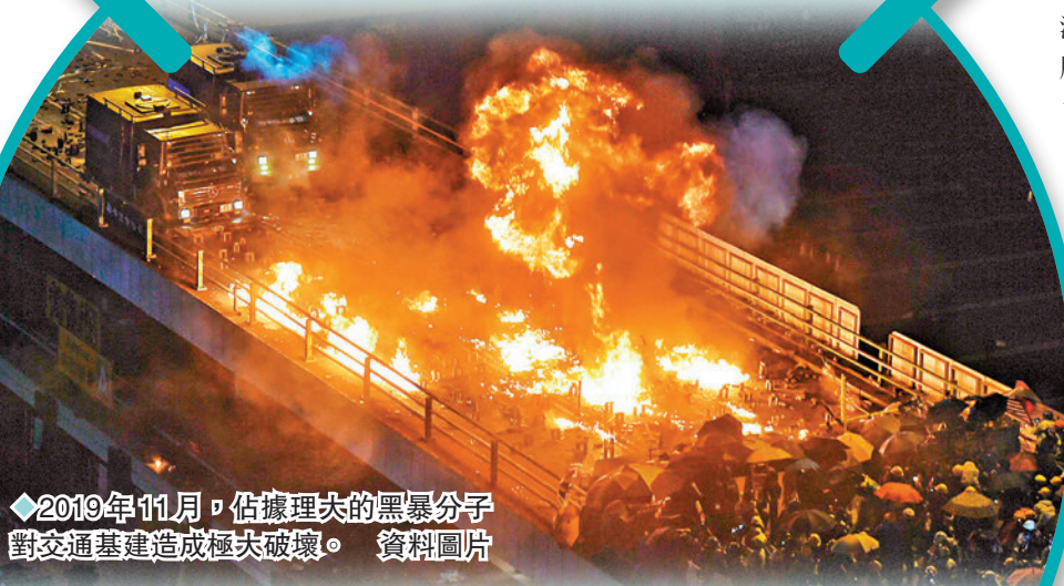
◆ 2019年11月，佔據理夫的黑暴分子對交通基建造成極大破壞。資料圖片