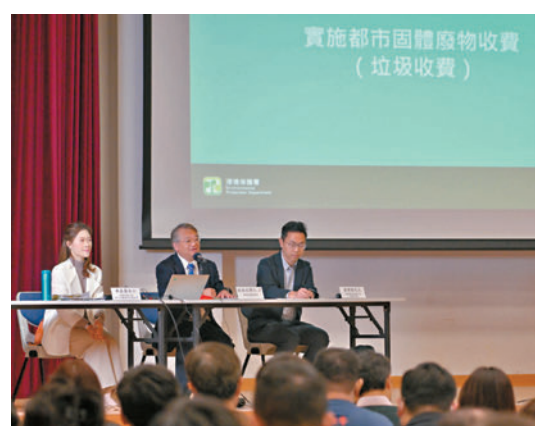
環保署署長徐浩光（中）為關愛隊舉辦首場垃圾收費簡介會。

他強調，要順利推行這項涉及全港各界的政策，地區力量的支持十分重要。他呼籲關愛隊成員在地區工作中，聯同區議員及其他地區人士大力支持和協助環保署的宣傳及政策解說工作。環保署會在九龍及新界區舉辦另外兩場為關愛隊成員而設的簡介會，為他們解釋垃圾收費的安排及執行細節，以便他們向市民解說。