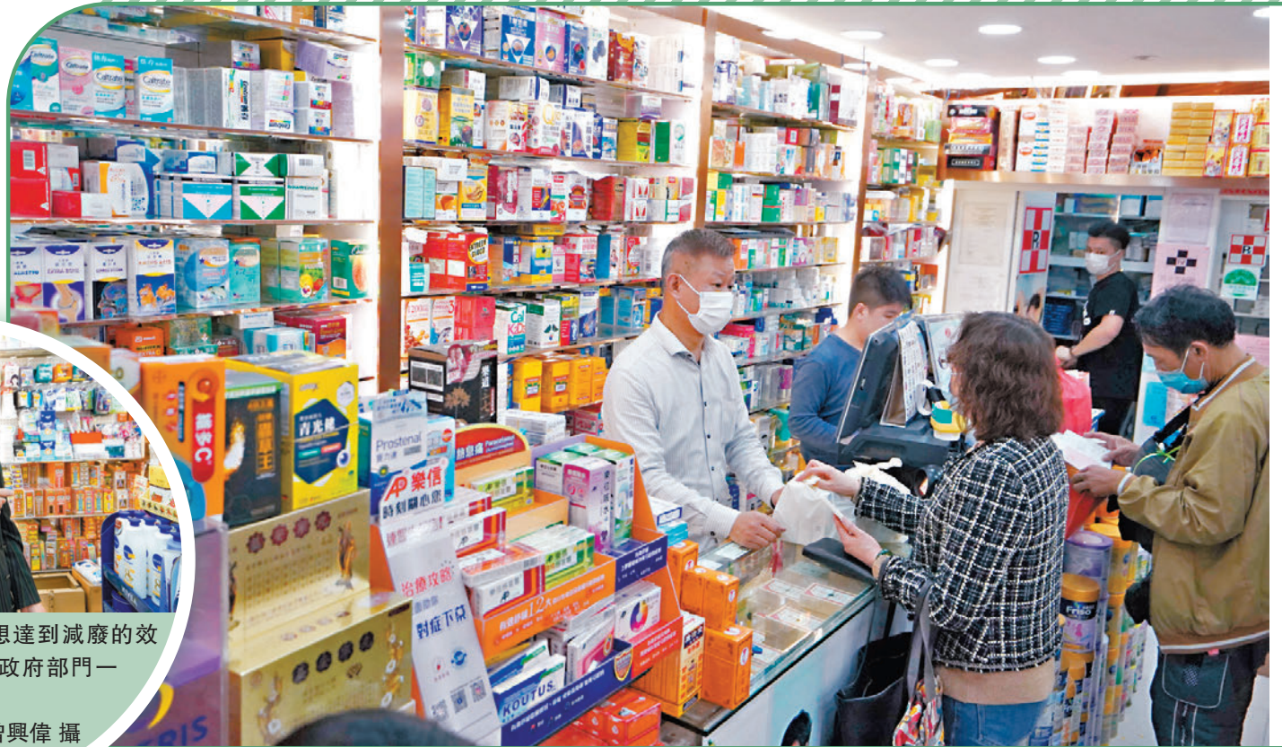
有藥房提早清貨走塑，準備配合新例實施。