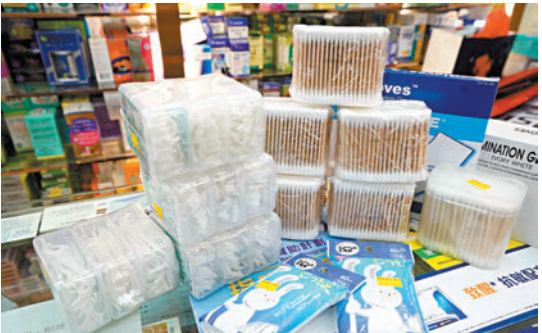
藥房貨架上已不見膠柄棉花棒，改售紙柄或木柄的棉花棒。

部分列入第二階段管制的商品，減廢效益更明顯，林偉民建議提早納入管制：「例如三盒牙線棒（的塑膠含量）差不多才等於一盒牙線的用量，從體積就能看出來。這個納入第一階段實施，我會更支持。」