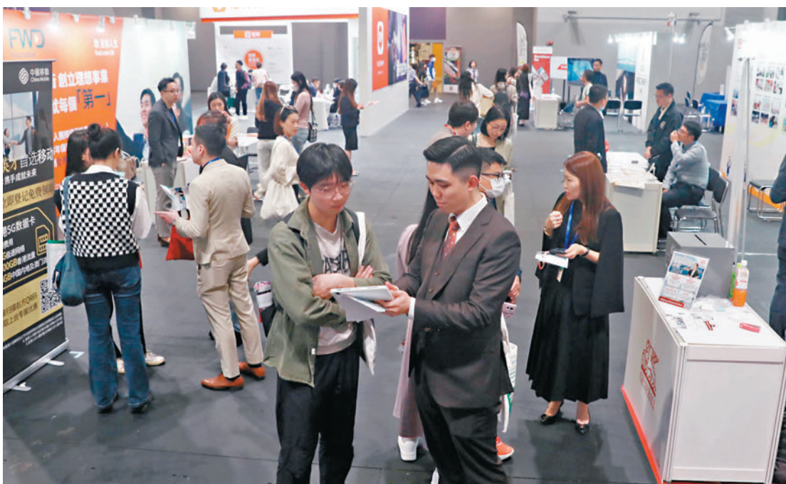
◆「創新香港——國際人才嘉年華」人頭湧湧，不少求職者在各攤位面前了解資訊。

香港經濟在疫情過後逐漸復甦，隨着市道改善，本地各行各業均極力招攬人才。大型招聘活動「創新香港——國際人才嘉年華2024（春季）」一連兩天舉行，昨日在香港亞博館開幕。昨日最後一天展期，大批應聘者抓緊機會排長龍等候入場，當中不少是在港升學的內地人和來自大灣區內地城市的人才。有首次參與人才嘉年華的參展創科企業指出，對這兩天的求職者的人流感到滿意，直言較以往在網上招聘的效果好，並認為香港人才具國際視野等，希望招聘到英文良好的香港人負責公司對外業務。還有在澳門及新加坡求學的求職者計劃來港工作，直言香港具有更廣闊的就業機會，對他們而言甚具吸引力。 ◆ 香港文匯報記者 張弦