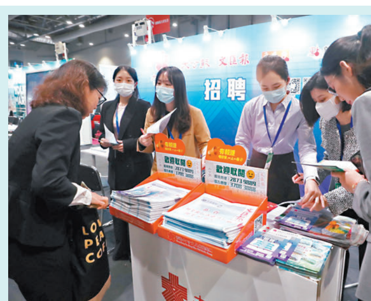
◆不少求職者到大文集團展位了解資訊。

香港文匯報記者昨日中午起在人才嘉年華現場直擊，只見場館外有不少人排隊等候進場，場內人流密集，不少求職者身穿正裝，到各參展企業攤位仔細瀏覽招聘職位的相关資訊，並不時與企業職員交流，更有參展企業即場與求職者進行面試。