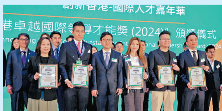
◆孫玉菡(前排左三)與得獎者合照。

王傲山一向注重人才挑選和團隊培養，認為「一個人創業有時頗孤獨，就像再好的酒，亦要有人分享才有味道。」圓桌家族是友邦發展最迅速的團隊，有超過1,000位專業財富管理顧問，是全港唯一提供雙引擎事業發展的平台。