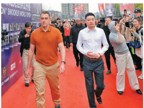
◆奧蘇利雲(左)及丁俊暉走上大賽紅毯。

香港文匯報訊(記者 任芳頤 玉山報道)3月18日至24日備受矚目的2024世界桌球公開賽將在江西玉山盛大舉行，是該賽時隔5年後回歸中國，並再次來到江西玉山。「火箭」奧蘇利雲、中國桌球「一哥」丁俊暉，以及卓林普、沙比、張安達等世界級球星參賽。