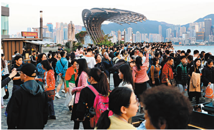
◆旅發局預期，今年訪港旅客量增長三成半。資料圖片