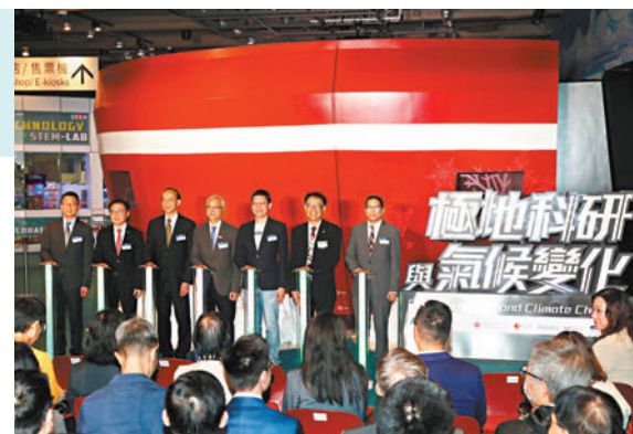
◆「極地科研與氣候變化」專題展覽昨日在香港科學館正式開幕。