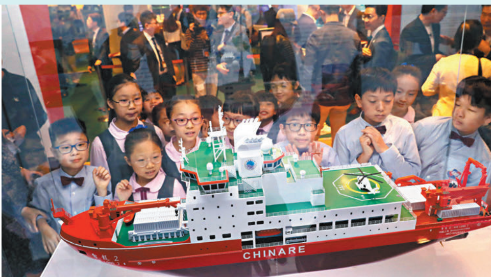
◆科學館昨日起至6月舉行「極地科研與氣候變化」展覽，學生們在「雪龍2」號科考船模型前仔細觀察，為下月「雪龍2」號訪港上船參觀做好準備。