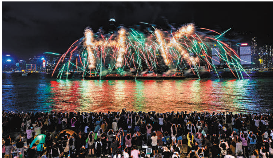
◆以往煙火表演效果。