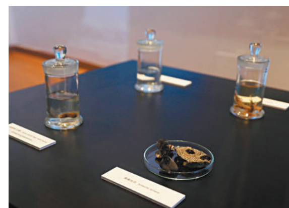
◆展出包括在極地收集的生物標本。

香港文匯報訊（記者 文森）國家第一艘自主建造及全球第一艘採用艙艙雙向破冰技術的中型破冰船「雪龍2」號將於4月8日起訪港5天。尖沙咀香港科學館昨日率先推出新專題展覽「極地科研與氣候變化」，展示中國極地考察破冰船「雪龍2」號的科學考察任務及科研成果，啟發入場者思考氣候變化的嚴重性。專題展覽亮點展品除了「雪龍2」號的1:100模型外，在極地所收集的生物標本亦是焦點，包括「南極地衣」、「北極燈蛾（幼體）」、「裸海蝶（海天使）」及「南極磷蝦」。展期由即日起至6月26日，免費入場，歡迎市民到場參觀。