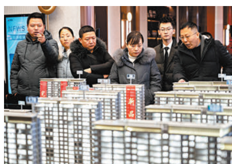
◆今年前兩個月，居住消費類的部分商品零售額有所改善。圖為山西太原市民在一家房地產售樓部看房。

香港文匯報訊（記者 海巖 北京報道）今年開年在製造業、基建投資增速加快，房地產投資降幅收窄的帶動下，內地1-2月固定資產投資增速超預期上行。一個更加提振市場信心的信號是，民間投資增速由負轉正，1-2月民間投資