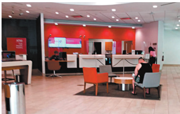
◆銀行提供的理財建議，被指不符合客戶利益。

香港文匯報訊(特約記者 成小智 多倫多報導)加拿大5大銀行傳壓迫員工向客戶推銷潛在高成本或高風險金融產品，若員工未能達標將會遭到解僱。加拿大廣播公司(CBC)就此探討銀行如何培訓僱員，並由記者假裝顧客測試銀行的誤導客戶手法。消費者權益組織批評監管當局沒有嚴厲整頓銀行業歪風，導致普羅客戶的利益受損。