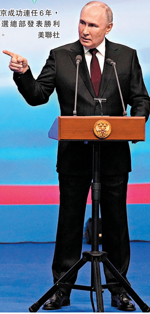
◆普京成功連任6年，在競選總部發表勝利演說。

對於今年美國總統大選，普京再次表示，俄方對任何一位美國總統候選人都沒有偏好，俄準備與美國選民投票支持的任何美國領導人合作。