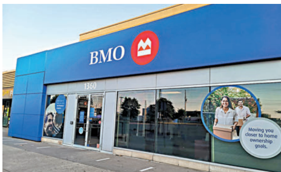
◆滿地可銀行前員工承認無法承受推銷壓力而選擇辭職。