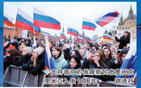
◆支持普京的俄羅斯民眾慶祝克里米亞入俄10周年。