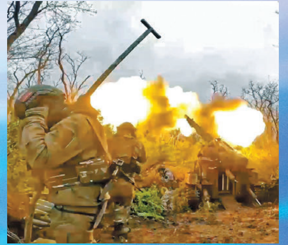
▲普京強調支持與烏和平談判，但不能只是因為對方子彈快用完。