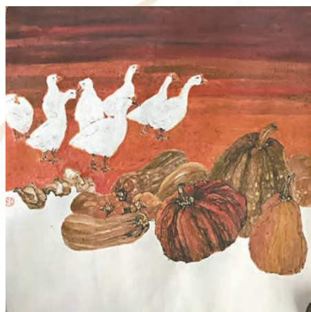
◆《歲月》 60cm x 60cm