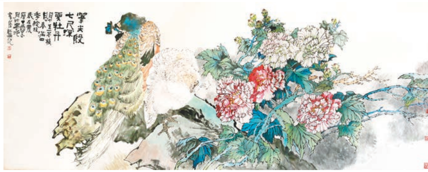
◆《國色天香》 248cm x 96cm

畫家簡介：張天一（光明），1974年生，中國美術家協會會員、中國工筆畫學會會員、國家二級美術師、安徽省政協書畫院理事、民進開明書院理事、陝西山水畫研究院訪問學者、北京榮寶齋書畫院畫家。《徽鄉遺韻》《鄉戀》《夢田》《夢裡徽州》等多幅作品入選全國美展。