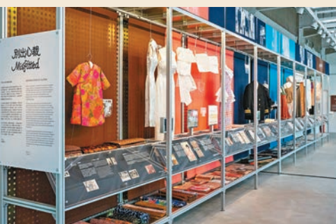
◆「別出心裁：不為人知的裁縫故事」介紹不同用途的本地織品。