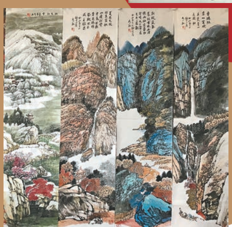
◆《春夏秋冬》四屏 138cm x 34cm x 4

在不斷臨摹、寫生與創作的過程中，張天一以繼日地耕耘着自己的丹青。他「入古」臨畫一摹就是整個通宵，背着畫板在戶外寫生一畫就是一整天，為了抓住靈感創作而廢寢忘食。如今，他不僅實現了用筆熟練老到，不事雕琢，更讓畫面的造型和達意均達到了游刃有餘的地步。皖南民居、山野家禽，抑或是大山大水，都在他隨心所欲的用筆之間，依興而暢，他借助筆墨乾、濕、濃、淡的層次交替，將藝術創作與生活結合，筆下的萬物躍然紙上。