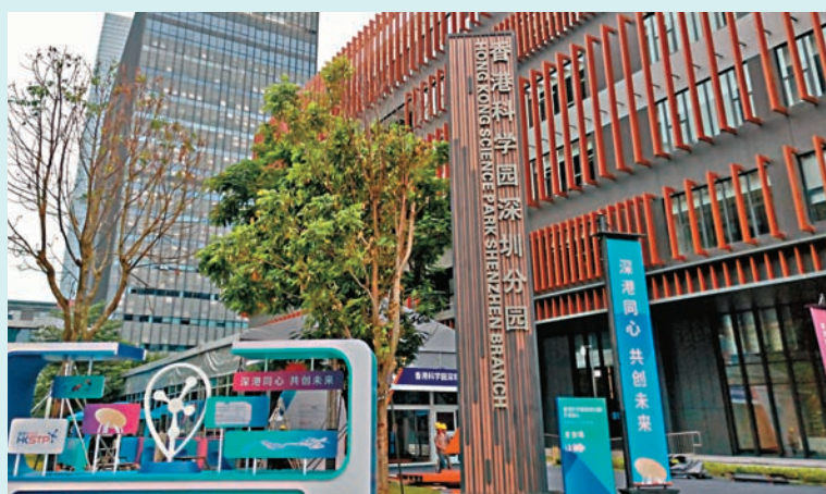
◆在數據跨境流動創新探索上，粵港澳大灣區一直擔當先行先試的重任。圖為香港科學院深圳園區。

直擔當先行先試的重任。去年底，國家互聯網信息辦公室、香港創新科技及工業局發布《粵港澳大灣區（內地、香港）個人信息跨境流動標準合同實施指引》。專家分析，後續大灣區探索數據跨境流動規則，在科研、口岸等特定領域數據跨境至港澳方面探索制定管理辦法、細則等，探索建立閉環監管、跨境協同等機制，探索數據要素確權和定價規則等。