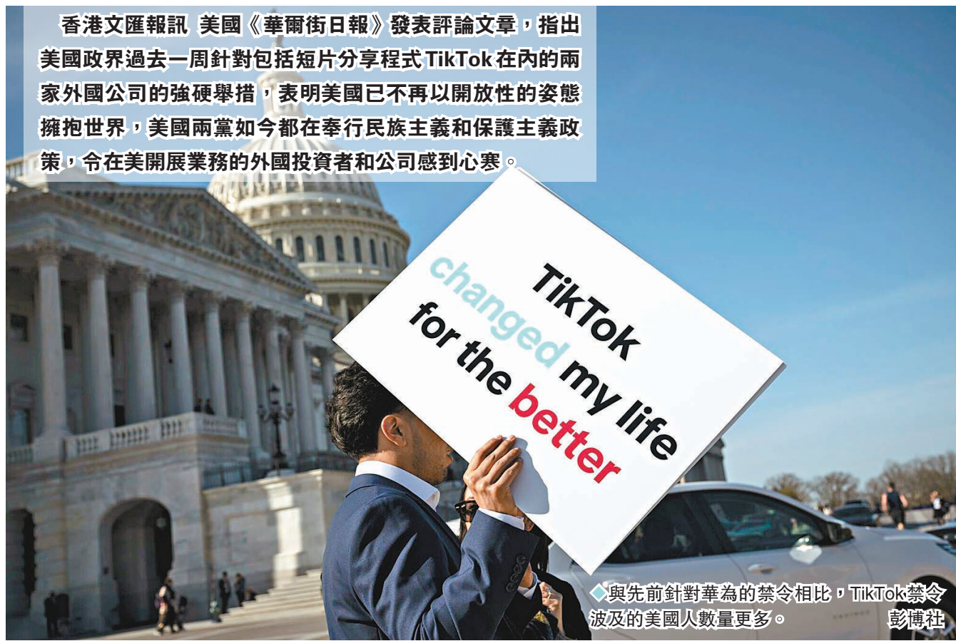
香港文匯報訊 美國《華爾街日報》發表評論文章，指出美國政界過去一周針對包括短片分享程式TikTok在內的兩家外國公司的強硬舉措，表明美國已不再以開放性的姿態擁抱世界，美國兩黨如今都在奉行民族主義和保護主義政策，令在美開展業務的外國投資者和公司感到心寒。