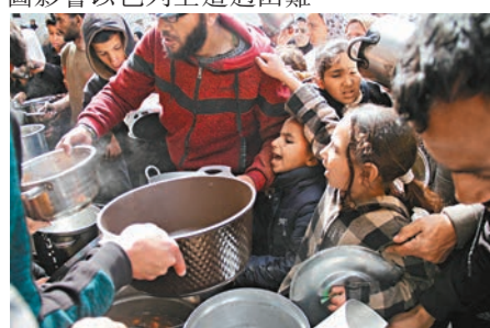
◆加沙半數民眾正處於「災難性」飢餓狀態。

聯合國糧農組織（FAO）副秘書長貝克多表示，總人口中有50%處於災難性、幾乎是饑荒的程度，以前從未發生過，這也是在2004年啟動的「糧食安全階段綜合分類」系統，記錄到最多人口面對災難性飢餓的一次。聯合國人道事務與緊急援助負責人格里菲斯呼籲以色列允許援助物資不受阻礙地送入加沙，指出「已沒有時間可浪費」，「國際社會應要為未能阻止這種狀況而覺得羞愧。」