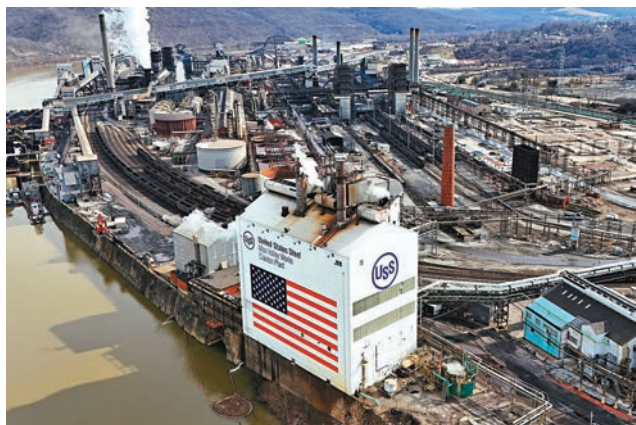
◆拜登反對新日本製鐵公司收購美國鋼鐵公司。 美聯社

去年中國一躍成為全球最大汽車出口國，美國官員擔心這可能會破壞美國培育本土電動車產業的計劃。特朗普將對中國汽車徵收的關稅稅率提高到27.5%，拜登政府官員正討論進一步提高對中國電動車的關稅，他們擔心27.5%的稅率無法將中國電動車拒之門外。一些美國官員私下依然承認，美國公司會受惠於與日本製鐵和寧德時代等外國公司的合作。只是別指望拜登或特朗普會在今年競選活動中提出這樣的觀點。