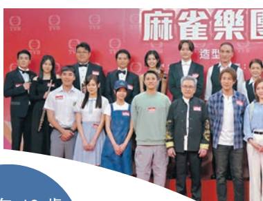
◆一眾主創合影留念。

庭鋒有感情線，對方查案時自己會參與幫手。首度拍劇的黃洛妍，坦言工作來得突然，沒有太多預備，但都是新嘗試。劇中要拉小提琴的她，被指是本色演出，應該沒有壓力？她就謙稱也不是沒壓力：「因要配合鏡頭，當作係拍MV。」說到她剪去了黃色頭髮後變得斯文，她笑說：「其實參加歌唱比賽前就係咁，後來才染吃黃色，我唔係反叛，內心就係咁。」