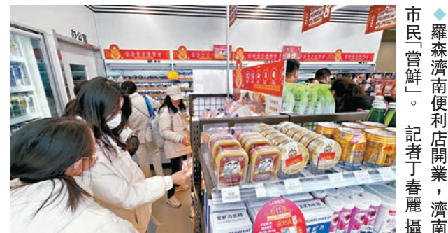
◆羅森濟南便利店開業，濟南市民「嘗鮮」。

「17家門店同時開業，這是羅森在同一天開店數目最多的紀錄。」羅森投資有限公司總裁三宅示修在致辭中稱，截至2023年末，羅森全球店舖數已超過21,934家，中國的店舖數超過6,330家。在他看來，山東省是中國的經濟大省，有上億人口，是一個龐大的消費市場。此次進軍山東市場，這也是羅森在中國實現萬店目標的關鍵一環。冰麻薯、冰皮月亮蛋糕、天香芋泥厚乳……在濟南高新區萬達廣場的羅森便利店，店裏的「網紅」美食貨架前人頭攢動，「嘗鮮」的市民排起了長隊。「把子肉」是濟南當地的特色美食，香港文匯報記者在店裏的貨架上竟然看到了「把子肉」圓飯團。羅森（山東）便利有限公司總經理堀江隆一稱，羅森的商品研發一直在強化「本地化」，這也是羅森同其他品牌全國一個模式的區別，各個區域都有自己的特色商品。