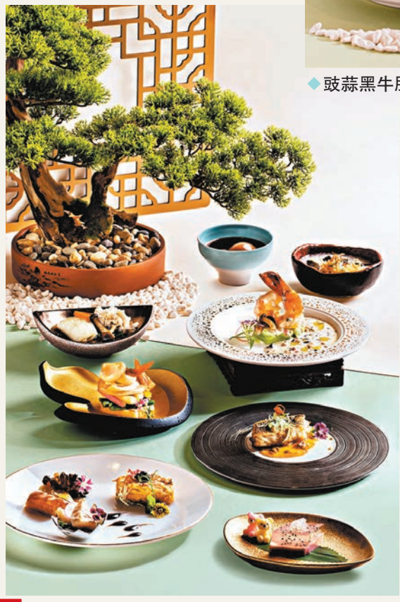
◆豉蒜黑牛肝菌炒龍蝦球