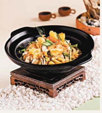
◆堂弄一砂鍋蝦頭油乾燻花膠