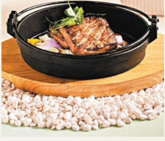
◆堂弄一煎煎三杯M5和牛柳