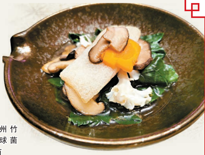
◆貴州竹筍繡球菌菠菜苗

「春眠不覺曉，處處聞啼鳥。夜來風雨聲，花落知多少？」春回大地，萬象更新，繁花盛放，綠草如茵。春芽爭相競逐，大自然展現出無限生機，這時各種時蔬菜苗鮮嫩爽口、魚產海鮮清新爽甜。帝京軒廚師團隊選取當造且滋補養生的優質食材，由即日起至6月30日期間呈獻養生盛宴「春曉宴」及單點菜單「養生嘗饌」，食客可享8折春日優惠，讓你與親友於春日一同品嘗養生美饌。