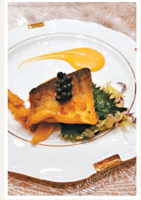
◆橄欖油胡椒無骨馬友魚