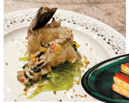
◆白松露汁香焗虎蝦皇

而薏仁小米泥鯔粥，因春天潮濕多霧，身體易水腫濕重，大廚特別用上祛濕消腫的薏米、滋陰除熱的小米與新鮮泥鯔拆出的魚肉生滾成粥，鮮味可口，窩心暖胃。