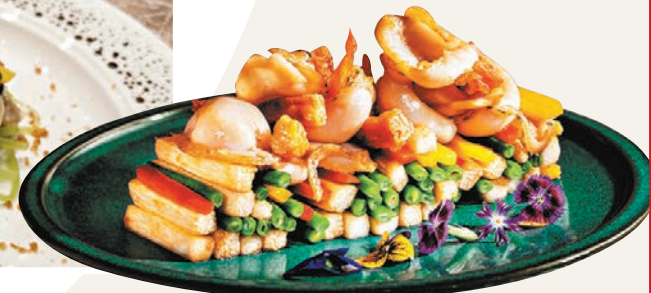
◆鮮淮山銀鈎炒澳洲鮑片