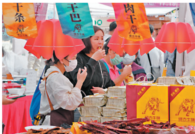
◆入場市民大快朵頤。