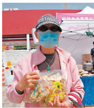
◆街坊李婆婆購買了花生糖。