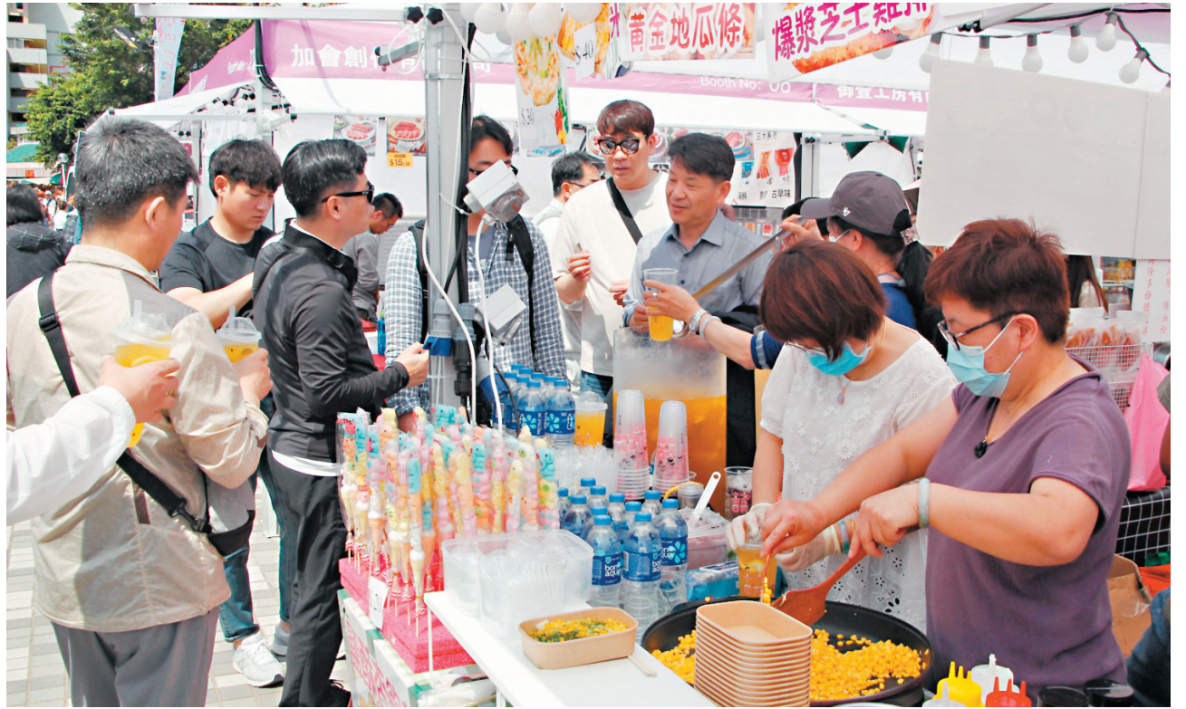
◆黃大仙繽紛美食墟昨日開鑼，展商期望生意能夠回復至疫前的八成。