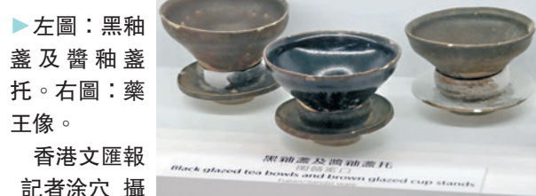
▶左圖：黑釉蓋及醬釉蓋托。右圖：藥王像。