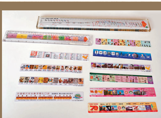
◆東華三院鄺錫坤 伉儷中學的師生展示收到的座標尺。