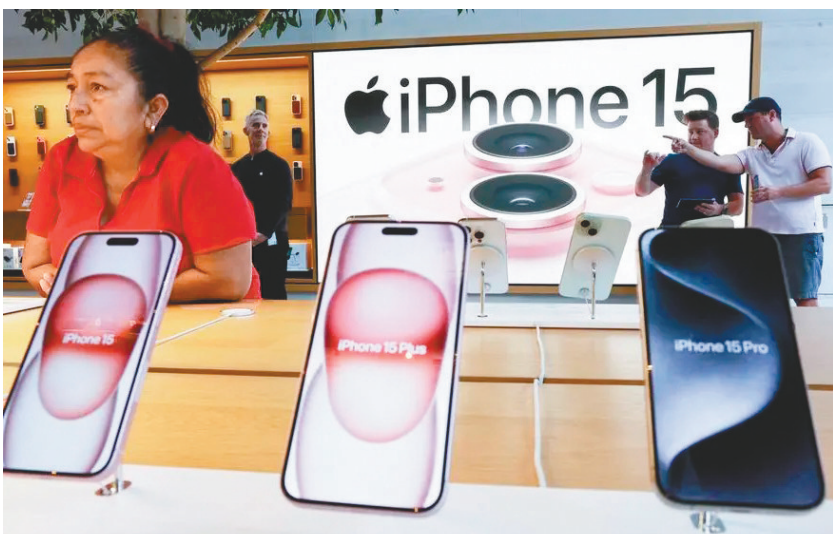
◆美國司法部指蘋果壟斷行為犧牲消費者、開發者和競爭對手手機製造商的利益。

依照歐盟針對科企巨擘的新法案《數碼市場法案》，蘋果在歐盟還可能面臨更嚴格的審查。報道指出，如果蘋果被證實違反該法案，可被處以最高達公司全球年收入10%的巨額罰款，再犯者罰款比例將翻倍至20%。