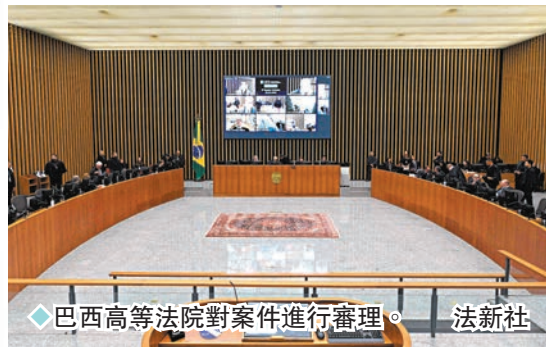
◆巴西高等法院對案件進行審理。

羅賓奴被指控於2013年在米蘭一家夜店參與了一宗輪姦案，性侵了一名慶祝23歲生日的阿爾巴尼亞女子，到2017年被意大利法院判罪名成立，入獄九年。2020年他在米蘭上訴法院敗訴，2022年意大利最高法院維持原判，