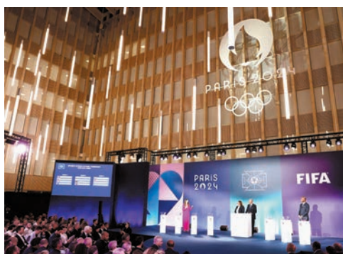
◆巴黎奧運會足球賽完成抽籤。

在去年舉行的巴黎奧運會女足資格賽亞洲區第二階段比賽中，中國女足1:1戰平韓國女足，積4分位列小組第三，無法晉級下一階段比賽，也因此失去巴黎奧運會參賽資格。巴黎奧運會男足賽將於7月24日至8月9日進行，女足賽將於7月25日至8月10日進行，相關賽事將分布在法國7個城市的球場展開。 ◆新華社、中新社