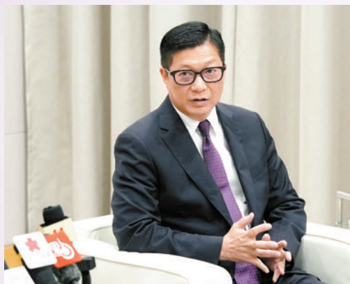
◆保安局局長鄧炳強

2019年黑暴期間，不少煽搞打砸搶燒的亂港罪犯潛逃海外，充當外國反華勢力傀儡，不時散播假新聞荼毒年輕人的思想，甚至叫囂外國「制裁」香港，令人髮指。條例實施後，保安局局長將有權把符合訂明犯罪元素的人透過憲報指名為潛逃者，取消其香港特區護照、專業資格，並禁止任何人向潛逃者租入不動產、成立合資企業等。