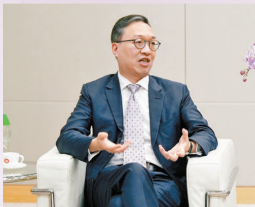
◆律政司司長林定國