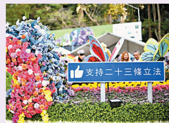
◆昨日，香港銅鑼灣維多利亞公園一花壇展示「支持二十三條立法」的標語。

他表示，特區政府已吸收了「應變反駁隊」有關經驗，就算相信今次「應變反駁隊」功成身退，日後在推出政策等不同情況下遇到別有用心的抹黑時，會參考有關的做法。