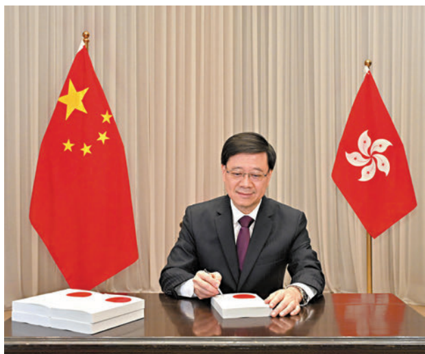
◆李家超昨日簽署《維護國家安全條例》。

權和自由，保護人權和自由的原則已經清楚明確地寫入法律條文當中，說明條例尊重和保障人權，依法保護根據基本法和兩個國際公約適用於特區所規定享有的人權