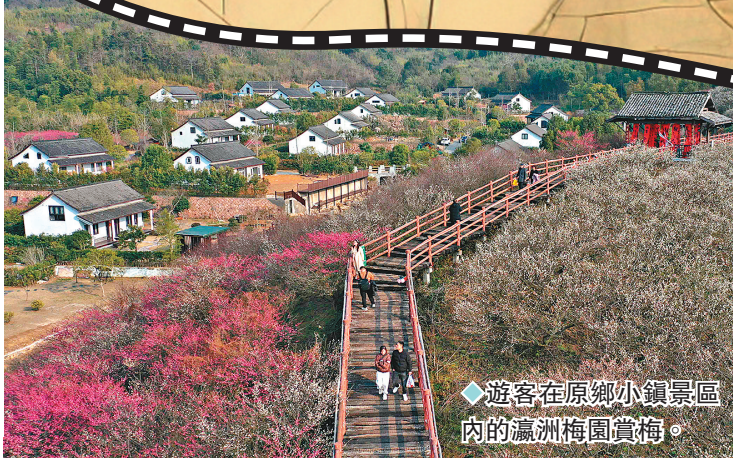
◆遊客在原鄉小鎮景區內的瀛洲梅園賞梅。