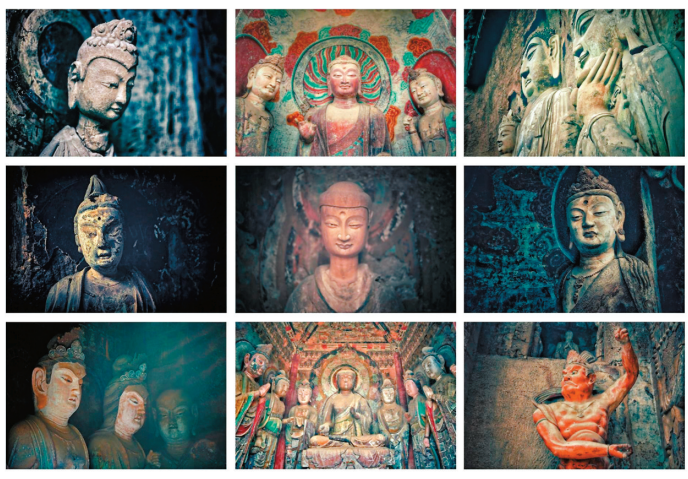
◆麥積山泥塑展現了當時藝術的最高水平。