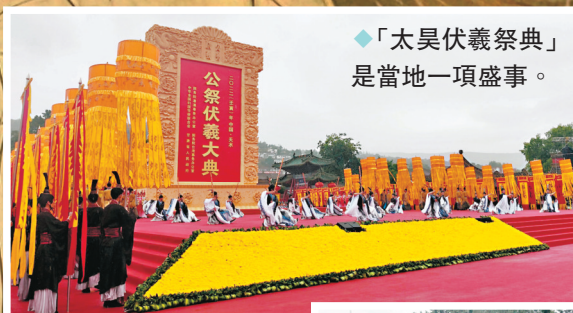
◆「太昊伏羲祭典」是當地一項盛事。