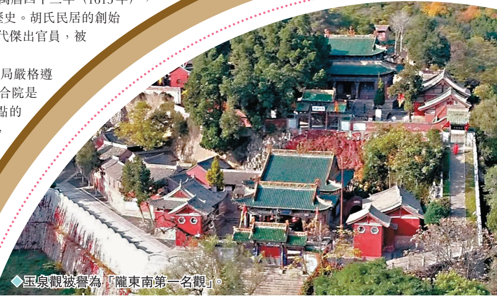
◆玉泉觀被譽為「隴東南第一名觀」。