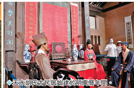
◆天水胡氏古民居始建於明萬曆年間。