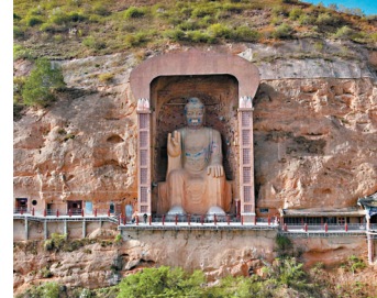
◆大像山大佛的高度在全國石胎泥塑大佛中名列第七。