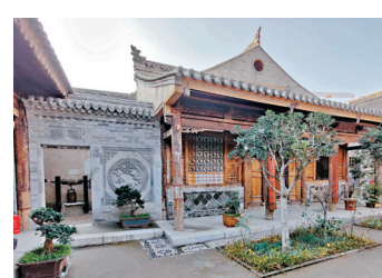
◆天水擁有眾多明清時期古民居建築群落。

位於天水市北部的玉泉觀，得名於元代的「玉泉」，其歷史可追溯到唐代。經過元、明、清三代的三十餘次擴建和重修，玉泉觀現已發展成為一個擁有九十餘座建築的龐大道教建築群，被譽為「隴東南第一名觀」，是探索道教文化的絕佳之地。 在水天周邊，同樣蘊藏着豐富的旅遊資源。武山縣的水簾洞石窟，始建於十六國時期的後秦，歷經北魏、北周、隋、唐、五代、宋、元等歷代的修建，形成了包括水簾洞、拉稍寺、千佛洞在內的一系列名勝古蹟。而甘谷縣的大像山，則是古絲綢之路上甘肅東南部融合石窟與古建築的重要文化遺址之一。大像山始建於北魏時期，主體建築大佛窟開鑿於盛唐時期。山上松濤陣陣，亭台樓閣依山勢巧妙布局。大佛殿，即大佛窟，坐落在大像山的山巔，是該山的主體建築。窟內的大佛神態莊嚴，目光和善，端坐於蓮台之上，其高度在全國石胎泥塑大佛中名列第七，是一處不可多得的宗教藝術寶庫。