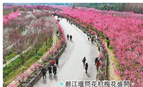
◆都江堰問花村梅花盛開。