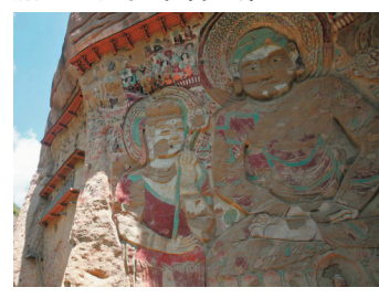
◆天水武山拉稍寺露天摩崖大佛，主佛通高42.13米，建於公元559年，距今已有1,400多年的歷史。