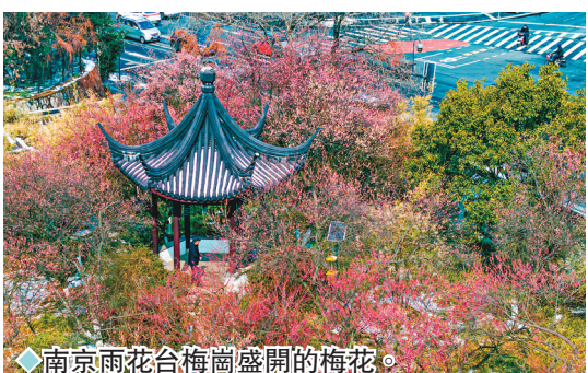
◆南京雨花台梅崗盛開的梅花。