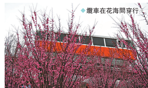
◆纜車在花海中穿行。