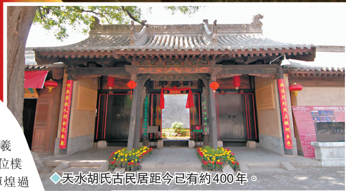
◆天水胡氏古民居距今已有約400年。

胡氏民居作為私宅，其建築格局嚴格遵循了中國傳統四合院的設計。四合院是一種以正房圍繞中央庭院為特點的傳統住宅形式，四面房屋相連，走廊互通，即便在雨天也能避免淋雨之苦。與北京四合院的馬鞍架結構不同，胡氏民居的廂房採用了具有天水特色的「一坡水」建築方式，展現了濃郁的地方風格。自明萬曆年間建成以來，南北宅子的正屋未曾經歷大規模翻修，至今仍保留着400年前的原始風貌，這在國內極為罕見，成為了研究古代民居建築的寶貴實例。