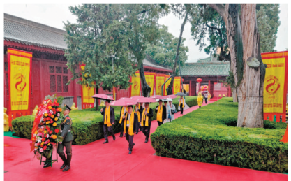
◆海內外的華夏子孫前來朝聖祭祖。

院以太極殿與後花園相連，體現了古代宮廷建築的嚴謹布局。花園內，綠樹成蔭，奇石崢嶸，每一步都似在畫中遊。