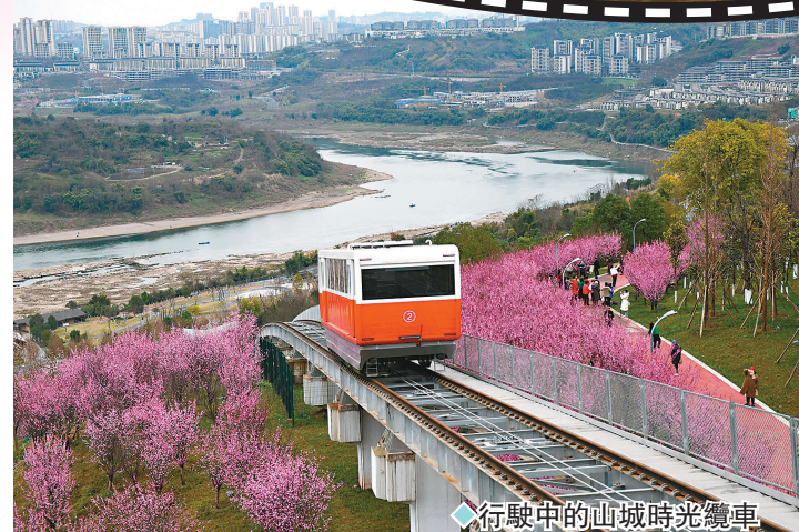
◆行駛中的山城時光纜車