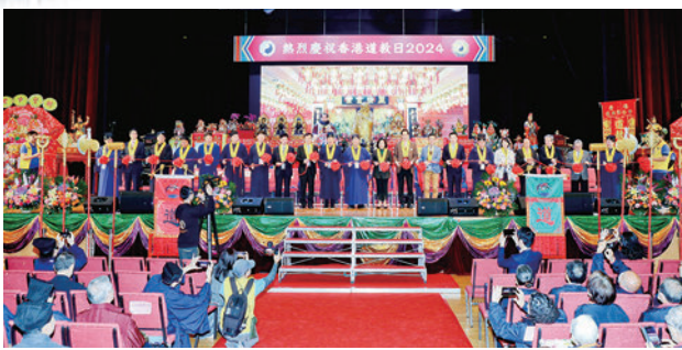
◆主禮嘉賓為香港道教日開幕禮暨仙真朝賀祝誕典禮剪綵。

香港道教聯合會聯合會屬道堂宮觀及學校於日前(3月10日)舉辦「香港道教日仙真出巡暨祈福大巡遊」，作為本年道教日系列慶祝活動之一。同日，大會假石門新界鄉議局大樓舉辦「甲辰年香港道教日開幕禮暨仙真朝賀祝誕活動」，以增進本港道教的團結，並引起大眾對道教及中華傳統文化的關注與認識。