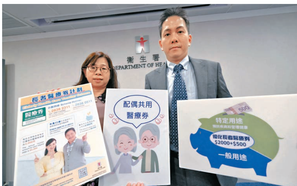
◆衛生署指出在2023年已經有98%的合資格長者使用過長者醫療券，而近年推出的容許配偶共用措施、長者醫療券獎賞先導計劃深受歡迎。

黃建豪表示，不少家屬在長者離世後使用其身份證申領醫療券接受醫療服務，曾有人最多拿完8,000元的額數。他指出，有兩宗個案成功檢控，合共有兩名醫療券使用者的家屬因盜用他人