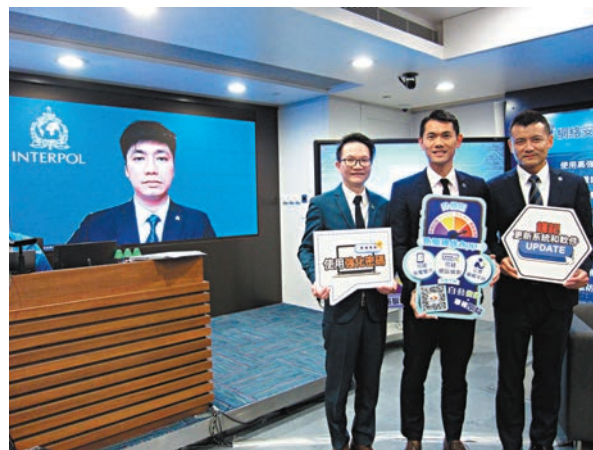
◆香港警方聯同國際刑警視像會議總覽兩次淨網行動成果，以及提供網絡安全建議。

此外，黑客甚至可以利用已被攻陷的電腦，向受害者所屬公司進行橫向攻擊其他同事的電腦，以及實時監察受害人使用電腦情況，包括登入網絡銀行服務(e-banking)時所輸入的密碼等。當黑客存取所有重要資料後，便是「最後一擊」將受害人電腦內所有檔案進行加密，以勒索贖金。