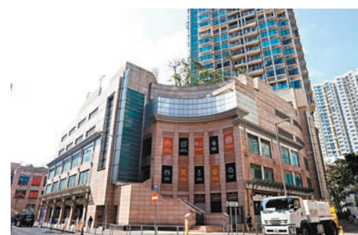
◆事發於九龍城沙浦道「御·豪門」一個高層單位。

社會福利署回應指，有關女童及其家庭並非該署社工的跟進個案。該女童現正留院，該家庭的其他兒童則已由其親屬照顧。社會工作接觸有關家庭，並召開保護懷疑受虐待兒童的專業個案會議，為有關兒童制訂合適的福利計劃及作出跟進。