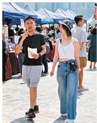
◆不少市民打扮清涼迎接夏日「早到」。