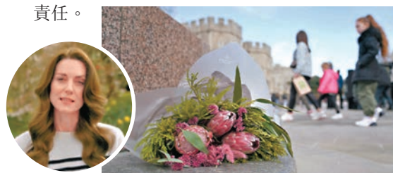
◆有民眾到溫莎堡外擺放鮮花。

特一名密友透露，影片文字稿是凱特親自寫下一字一句且很快完成，選擇發布影片而非文字聲明，也是希望能安撫民心，讓大眾更安心接收消息，除了希望平息外界更多臆測外，還認為自己的王室身份，有必要公開病況，更重要的是她知道自己是公眾人物，肩負更廣泛的領袖責任。