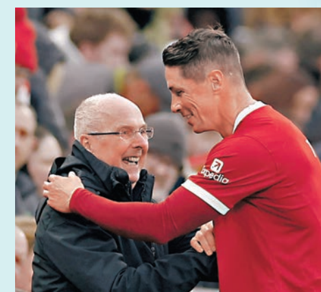
◆艾歷臣(左)與費蘭度托利斯。

不能明言。」今場是利物浦傳奇隊對阿積士傳奇隊的慈善賽，利物浦方面由「神奇隊長」謝拉特領銜費蘭度托利斯(費托)、杜迪克、史卡迪爾、丹尼爾艾格和麥斯洛迪古斯等昔日名將出戰，下半場則換上古積特、施斯和希比亞等名宿，阿積士方面則有荷蘭名宿戴維斯助陣。上半場落後兩球的利物浦，換邊後由域奴、施斯、艾沙亞及費托連入四球，反勝4:2完場。