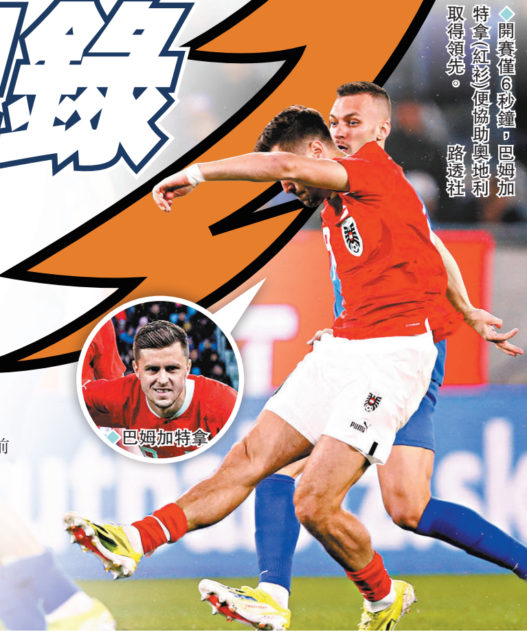
◆開賽僅6秒鐘，巴姆加特拿(紅衫)便協助奧地利取得領先。

香港文匯報訊(記者 梁志達 綜合報導) 巴西隊新任教頭杜利華祖利亞，在本港時間24日凌晨作客溫布萊球場的足球熱身賽中，領軍以1:0勇挫勢頭上佳的英格蘭隊，一箭定江山的巴西新星安迪克更成為在溫布萊球場取得入球的最年輕球員。