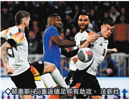
◆卻奧斯(右)重返德足即有助攻。

今年20歲的科利安華迪斯在利華古遜青訓出道，2020年獲提拔上一線隊即備受重用，本賽季會正式賽事36戰貢獻11入球17助攻，當中德甲7射10傳協助利華古遜正邁向隊史聯賽首冠。「我認為當時還沒有人意識到發生什麼