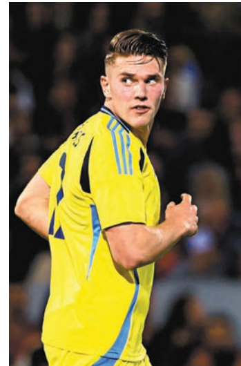
◆瑞典前鋒基奧基尼斯上場友賽攻入一球。