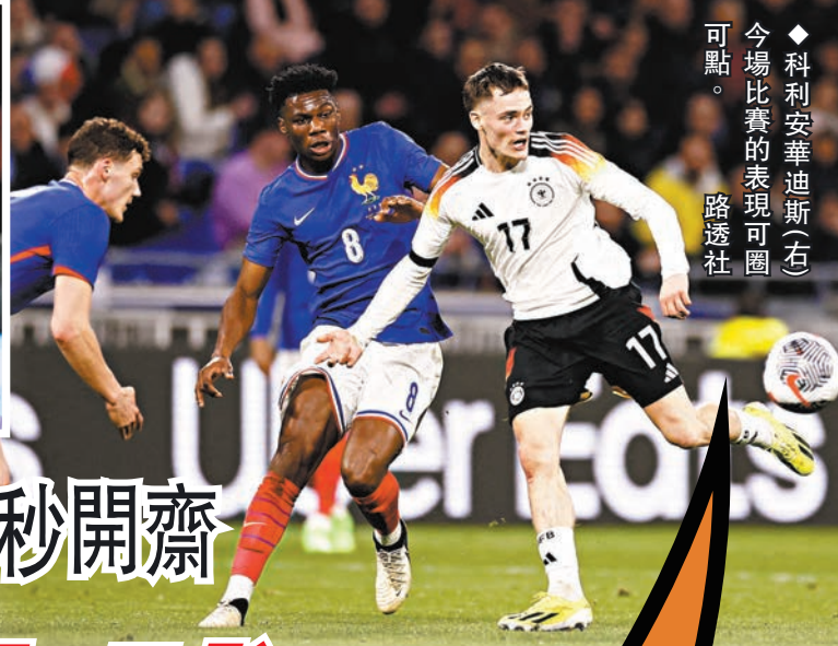
◆科利安華迪斯(右)今場比賽的表現可圈可點。