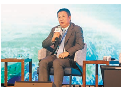
◆陶景文指，華為準備把深圳打造成內地第一個「超充之城」。

同場小鵬汽車副董事長兼總裁顧宏地表示，公司關注的不僅是新能源車的電動化部分，實際上是瞄準了整個端到端的體驗，如關注上游材料、製造、設計、使用操作和回收等。他提到，未來如果想提高智能電動車在道路上的滲透率，車輛的成本將是一大關鍵因素，因此公司在接下來的幾年希望可以做到大幅降低成本，以及減少使用這些技術的障礙。