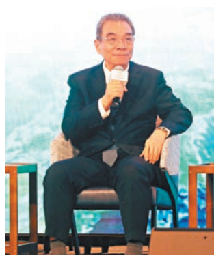
◆林毅夫表示，落後國家要致富，就需要工業化，但不能再走釋放大量二氧化碳的老路。

陳繁昌續指，人工智能與科技創新對推動可持續發展有很大助力，上周有報道指沙特阿拉伯正在創建一個價值約400億美元的基金，用於投資人工智能，他表示雖然相關投資不保證成功，存在一定風險，但這對於推動社會進步與可持續發展具有正面意義。