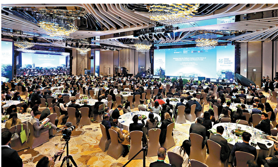
◆在昨日的世界合一論壇上，有專家認為中國在可再生技術領域處於世界領先地位。

林毅夫指出，中國的新發展理念，包含創新、協調、綠色發展，以及共享繁榮。他提到，過去十年，中國在治理城市污染方面取得長足進步。如果外國友人到訪中國各大城市，會發現都是綠色的，和歐洲以及美國的主要城市相仿。這主要是中國政府通過政策創新和鼓勵創新科技，兌現了綠色發展的承諾。