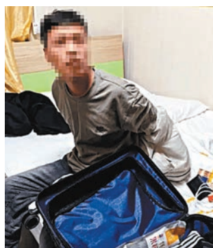
◆4名疑犯在內地落網。

被捕4名男子，分別姓劉（32歲）、姓何（33歲）、姓李（33歲）及姓于（36歲），均為內地人，涉嫌搶劫及持有禁用武器罪被扣查。