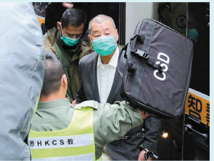
▶黎智英案第五十二日審訊。資料圖片