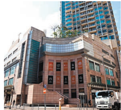
◆女童當日被發現昏迷在「御·豪門」家中浴缸。資料圖片

香港文匯報訊（記者 葛婷）一名4歲女童上週六（23日）被發現昏迷在九龍城家中有水浴缸內，送往伊利沙伯醫院搶救情況危殆，並被揭發身體有11處瘀傷，疑曾遭到虐打。其38歲母親昨日被控一項「對所看管兒童或青少年虐待或忽略」罪，押解九龍城裁判法院庭堂。裁判官余俊翔應控方要求，將案件押後至4月18日再訊，被告獲准以10萬元現金、不得重返案發場所等條件保釋。