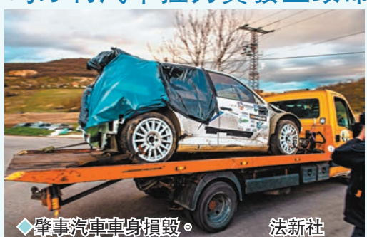
◆肇事汽車車身損毀。法新社

據匈牙利警方消息,在24日舉行的第11屆埃斯泰爾戈姆·涅爾蓋什拉力賽上,一輛參賽車輛衝出道路並衝入人群,造成至少4人死亡、7人受傷。事故發生在當地時間24日下午,地點在匈牙利北部巴拉特蘭至巴約特之間。當地警察局的一份聲明稱,參加比賽的車輛衝出道路撞向路邊觀眾,原因尚未明確,具體情況正在調查中。據當地媒體報道,事故發生後,比賽立即停止。8輛救護車和4架救援直升機被迅速派往事故現場救助傷者。 ◆新華社