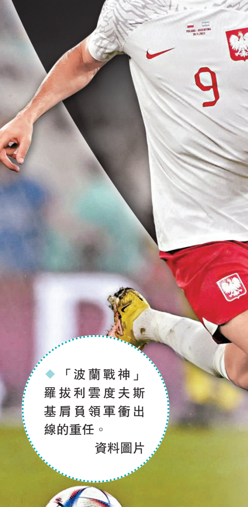
「波蘭戰神」羅拔利雲度夫斯基肩負領軍衝出線的重任。 資料圖片