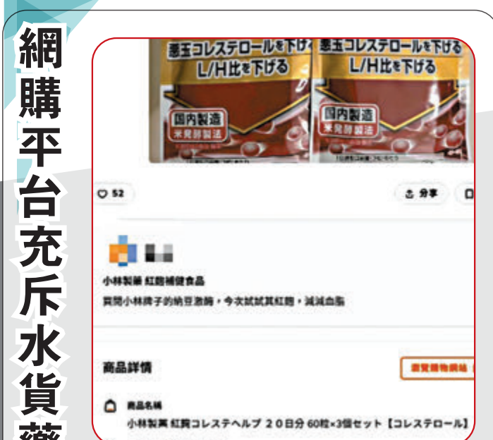
▲涉事的日本小林製藥株式會社製造的「紅麴膽固醇顆粒」在該平台以「水貨」的形式售賣。