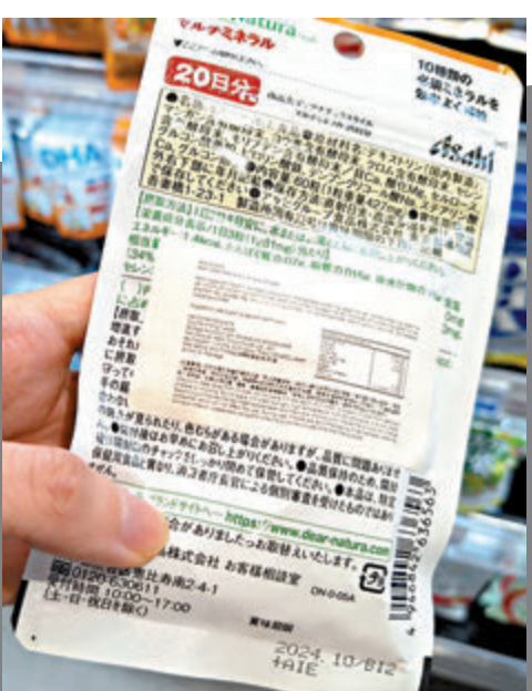
▲市面上的保健產品並無香港藥物註冊編號。