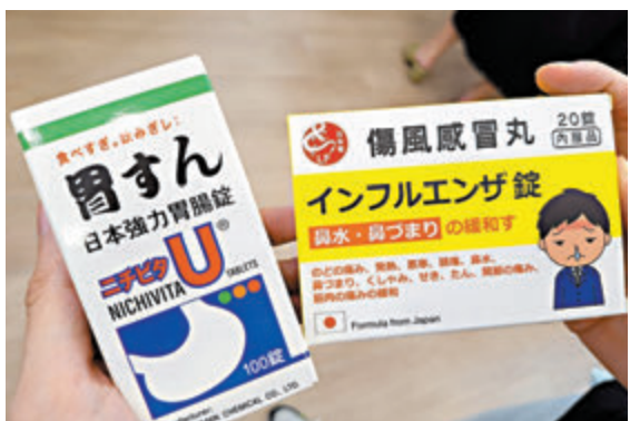
◆在香港藥妝店可以找到的日本水貨藥。

近年很多市民以調理身體、提高自身免疫力為由，自行到藥房購買保健產品，但小林製藥事件突顯「保健品」品質參差，卻無王管。香港醫院藥劑師學