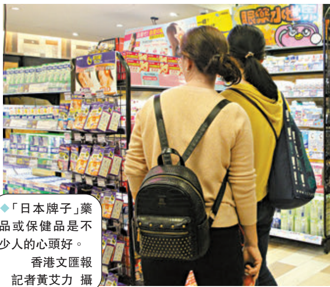
◆「日本牌子」藥品或保健品是不少人的心頭好。

他亦建議政府加強抽查保健食品，以保障其品質及安全性，如檢查食物標籤上所載的說明是否含有虛假或誤導成分，以及規管市面上的「藥房/藥妝」或者網絡平台上的售藥，包括檢查店舖所出售的藥物，是否出現有虛假的或不同於註冊時所批准的說明。