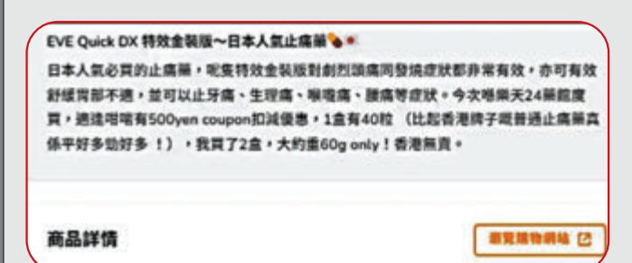
▲白兔牌「EVE」系列止痛藥以水貨形式售賣，並沒有香港藥物註冊編號。 香港網購平台截圖