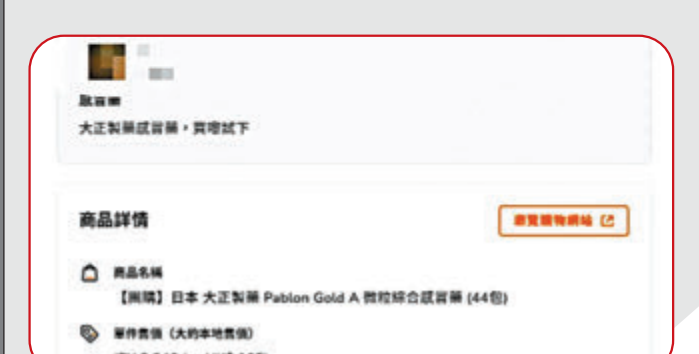
▲大正製藥「黃金A綜合感冒藥」以水貨形式售賣，並沒有香港藥物註冊編號。 香港網購平台截圖