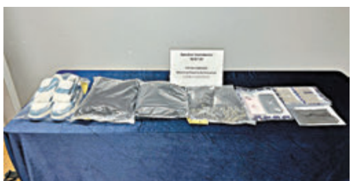
◆警方拘捕15歲輟學女童涉及多宗「猜猜我是誰」電騙案行動中，檢獲3部手提電話及犯案時穿着衣服。

香港文匯報訊(記者 葛婷)一名15歲輟學女童為幾百元報酬，在社交平台被「猜猜我是誰」電騙集團招攬向長者收錢。前日，