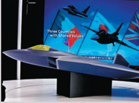
◆日本解禁與英國和意大利共同開發的下一代戰機向第三國出口。網上圖片

香港文匯報訊 日本政府周二(3月26日)在內閣會議上，決定解禁日本與英國和意大利共同開發的下一代戰機向第三國出口，並在國家安全保障會議上，修改了《防衛裝備轉移三原則》的運作指南。日媒報道，這一決定標誌着日本武器出口政策出現重大改變。中國外交部發言人林劍在例行記者會上表示，敦促日方切實尊重周邊鄰國的安全關切，深刻反省侵略歷史。