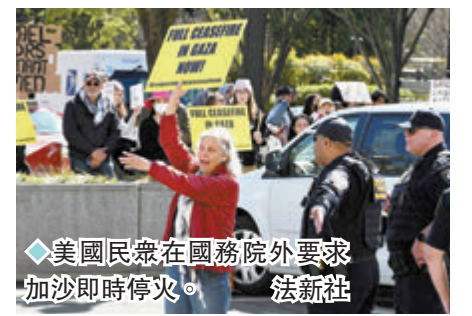
◆美國民眾在國務院外要求加沙即時停火。

分析強調，儘管美國總統拜登政府試圖淡化投票意義，但在處理中東局勢上，美國正面臨艱難選擇。以色列則堅持繼續進攻加沙，但在本次投票後，以色列會更清晰感覺到來自西方盟友的「被拋棄感」，相信此次投票是「全球如何看待以色列所作所為的重要時刻」。