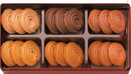
◆滋味什錦曲奇禮盒