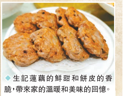
◆生記蓮藕的鮮甜和餅皮的香脆，帶來家的溫暖和美味的回憶。