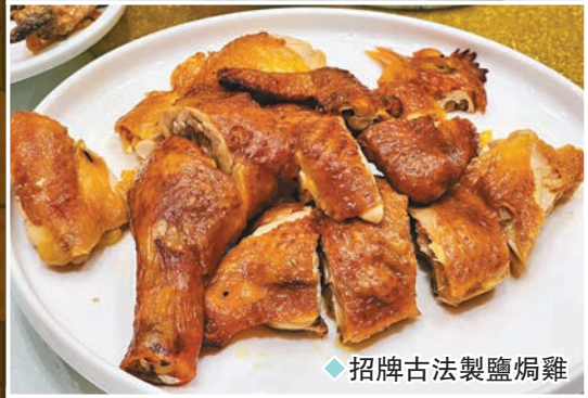
◆招牌古法製鹽焗雞