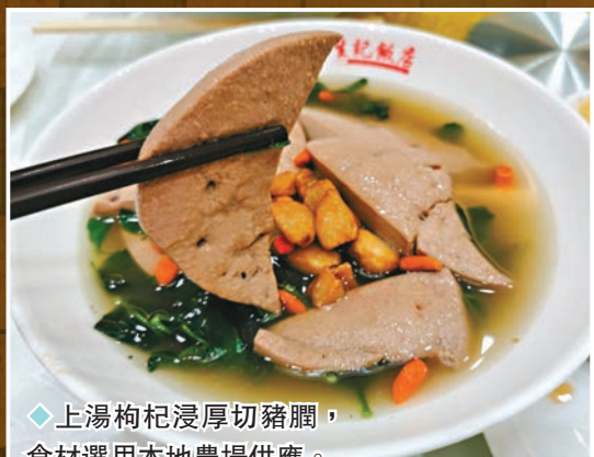
◆上湯枸杞浸厚切豬腩， 食材選用本地農場供應。