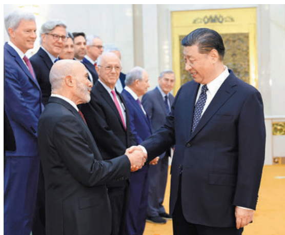
◆習近平會見美國工商界和戰略學術界代表。 新華社

習近平對美國工商界和戰略學術界人士在春暖花開之際訪華表示歡迎。習近平指出，中美關係是世界上最重要的雙邊關係之一。中美兩國是合作還是對抗，事關兩國人民福祉和人類前途命運。中美各自的成功是彼此的機遇。只要雙方都把對方視為夥伴，相互尊重、和平共處、合作共贏，中美關係就會好起來。今年是中美建交45周年。中美關係史是一部兩國人民友好交往的歷史，過去靠人民書寫，未來更要靠人民創造。中國有句話，從善如登，從惡如崩。希望兩國各界人士多來往、多交流，不斷積累共識，增進信任，排除各種干擾，深化互利合作，為兩國人民帶來更多實實在在的福祉，為世界注入更多穩定性。