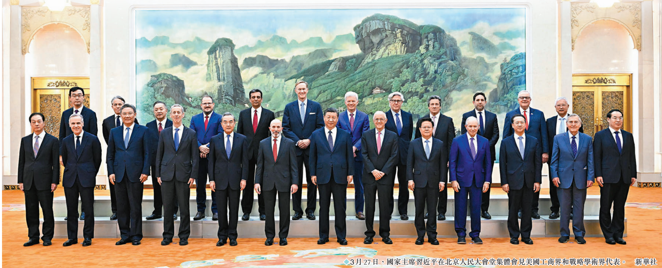
◆3月27日，國家主席習近平在北京人民大會堂集體會見美國工商界和戰略學術界代表。

香港文匯報訊 據新華社報道，3月27日，國家主席習近平在北京人民大會堂集體會見美國工商界和戰略學術界代表。習近平指出，中國經濟是健康、可持續的。去年中國經濟增速在世界主要經濟體中名列前茅，對世界經濟增長貢獻率繼續超過30%，這是中國人民幹出來的，也離不開國際合作。中國的發展歷經各種困難挑戰才走到今天，過去沒有因為「中國崩潰論」而崩潰，現在也不會因為「中國見頂論」而見頂。