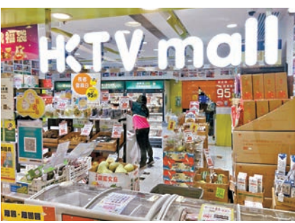
◆HKTV-mall每名客戶季度平均購買頻率稍為下降。