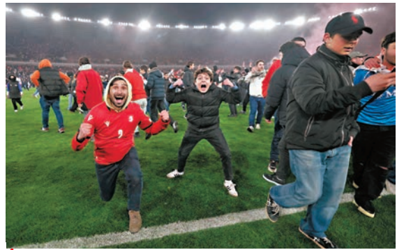
◆格魯吉亞球迷衝落球場瘋狂慶祝。

香港文匯報訊（記者梁志達綜合報導）在昨日凌晨的歐國盃附加賽A線決賽中，威爾斯未能把握住主場之利，在與波蘭隊互交白卷後互射12碼輸4：5飲恨。威足主帥佩治坦言，以這樣的方式緣盡決賽周感覺「殘酷」；而由羅拔利雲度夫斯領銜的波蘭隊則連續第五次打入歐國盃決賽周。