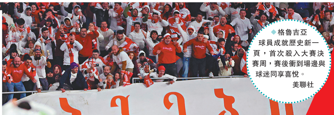
◆格魯吉亞球員成就歷史新一頁，首次殺入大賽決賽周，賽後衝到場邊與球迷同享喜悅。