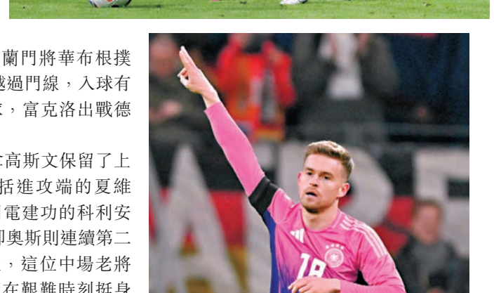
◆米圖斯達特首度為德國隊建功。