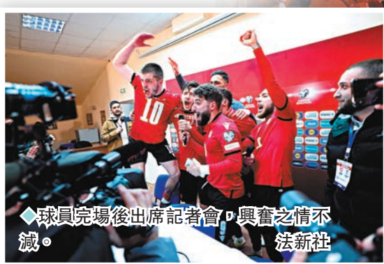
◆球員賽後出席記者會，興奮之情不減。

今夏舉行的歐洲國家盃24強全數出爐！格魯吉亞、波蘭及烏克蘭齊趕上尾班車躋身決賽周，格魯吉亞及波蘭兩隊同樣以互射12碼分別擊敗希臘隊及威爾斯隊晉級，當中人口只有約400萬的格魯吉亞更是首度殺入歐國盃甚至國際大賽的決賽周，上演一幕「足球小國」奇跡。 ◆香港文匯報記者 郭正謙 綜合報導